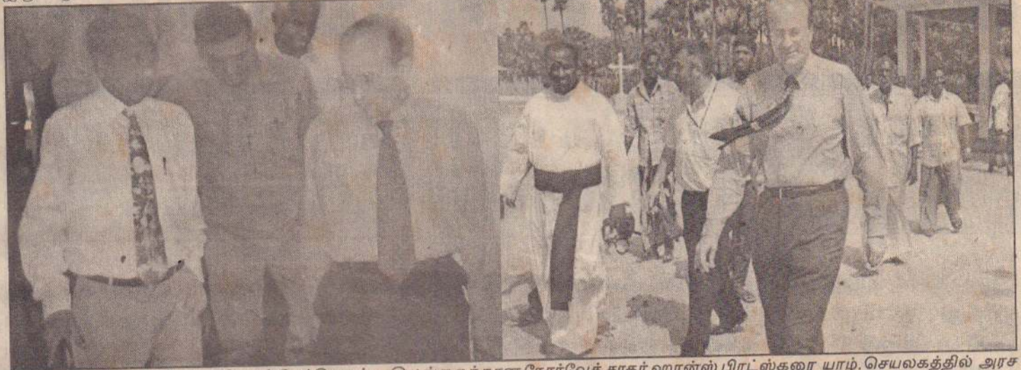
குடாநாட்டுக்கு நேற்று விஜயம் மேற்கொண்ட இலங்கைக்கான நோர்வேத் தூதர் ஹான்ஸ் பிரிட்ஸ்கரை யாழ்.செயலகத்தில் அரசு அதிபர் கே.கணேஷ் வரவேற்று அழைத்துச் செல்வதை முதற் படத்திலும் படுகொலைகள் நடந்த அல்லைப்பிட்டிப் பகுதியை நோர்வேத் தூதர் பார்வையிடுவதை அடுத்துள்ள படத்திலும் காணலாம்.

- இவ்வாறு பஞ்சலிங்கம் நோர்வேத் தூதரிடம் கோரியுள்ளார். (ப)