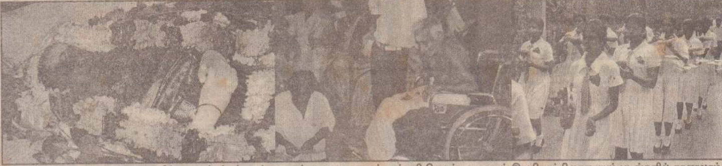
அன்னையின் பூதவுடல் அஞ்சலிக்கு வைக்கப்பட்டிருப்பதையும் அவரது கணவர் அஞ்சலி செலுத்துவதையும் இறுதியாத்திரையையும் படங்களில் காணலாம்.