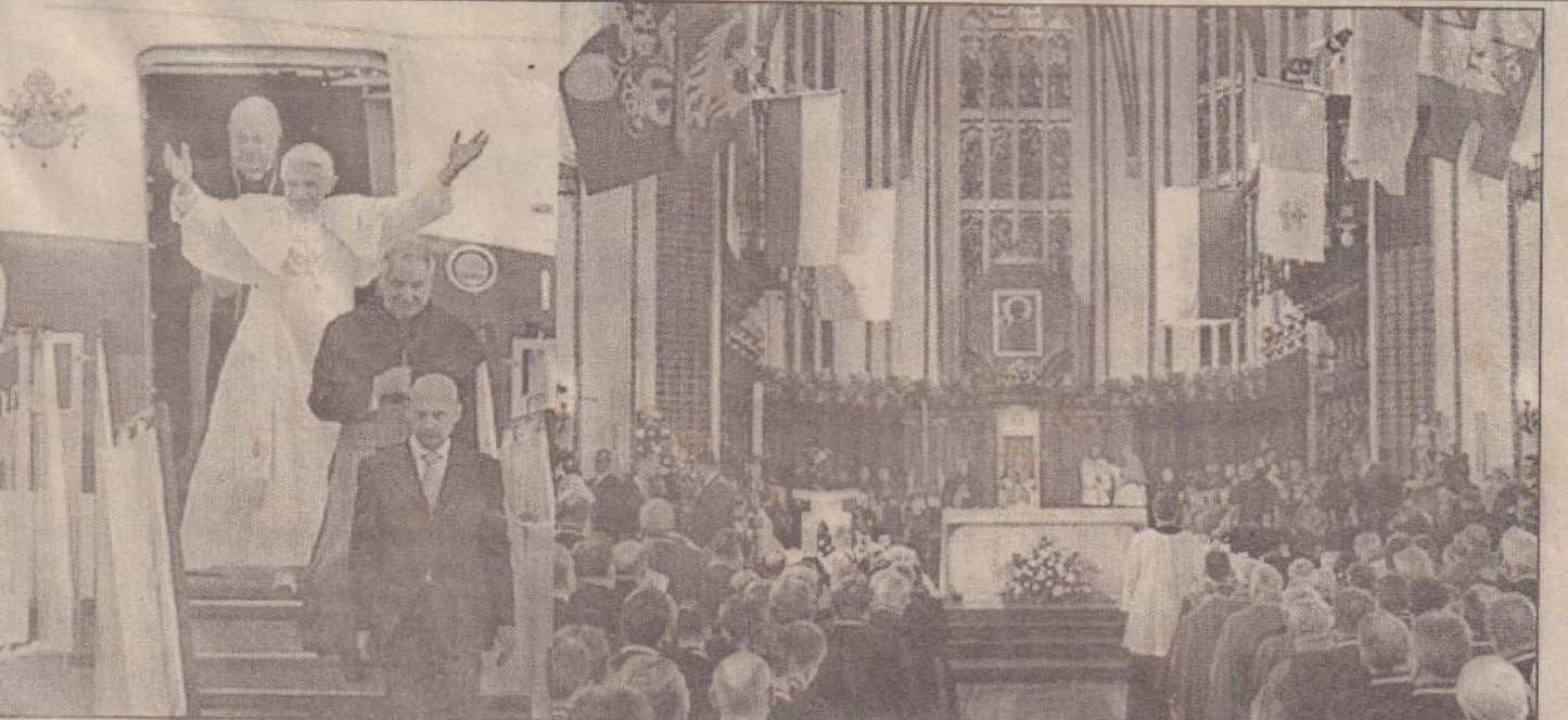
பாப்பரசர் 16ஆம் பெனஷூப் போலந்துக்கு நாளுக்கு நாள் விஜயம் ஒன்றை மேற்கொண்டுள்ளார். அவர் விசேட விமானத்தில் இருந்து இறங்குவதையும் புனித யோவான் பேராலயத்தில் திருப்பலி செய்துள்ளார்.

பாங்கொங், மே 27 தாய்லாந்தில் கடும்மழை மற்றும் வெள்ளத்துக்கு 100 பேர் பலியாகினர். 61 பேரைக் காணவில்லை. பலியானோர் எண்ணிக்கை மேலும் அதிகரிக்கலாம் என்று கூறப்படுகின்றது. வடக்கு தாய்லாந்தின் 5 மலைப்பகுதி மாகாணங்களில் கடந்த செவ்வாய்க்கிழமை அதிகாலை முதல் கனத்த மழை பெய்துவருகிறது. இதனால் பல இடங்களில் வெள்ளப்பெருக்குடன் நிலச்சரிவும் ஏற்பட்டுவருகிறது. சுமார் 1200 பேர் மட்டுமே பாதுகாப்பான இடங்களுக்கு அப்பறப்பட்டுத்தப்பட்டு நிலையில் 75 ஆயிரத்துக்கும் மேற்பட்டோர் மழை வெள்ளத்தால் பாதிக்கப்பட்டுள்ளனர். வடக்கு தாய்லாந்தின் உத்தாராதித் மாசானம் மழையால் மிகவும் பாதிக்கப்பட்டுள்ளது. இம்மாநிலத்தில் 100இற்கும் மேற்பட்டோர் உயிரிழந்திருக்கலாம் என்று கூறப்படுகிறது. இந்நிலையில், வெள்ளம் பாதித்த பகுதிகளில் நடைபெற்று வரும் நிவாரணப் பணிகளை அந்நாட்டுப் பிரதமர் தாக்சின் ஷின்வத்ரா கடந்த புதன்கிழமை பார்வையிட்டார்.