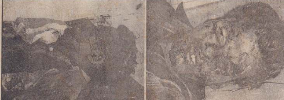
கல்வியங்காட்டில் நேற்றுப் படையினரின் சூட்டுக்கு இலக்காகி உயிரிழந்த இளைஞர்கள் இருவரினதும் சடலங்களைப் படத்தில் காணலாம்.

யாழ்ப்பாணம், மே 27 யாழ்.நகர் மைய நோட்டரக்ட் கழகத்தின் வருடாந்த சஞ்சிகையான அச்சாணியின் வெளியீட்டு விழா நாளையதினம் திங்கட்கிழமை பிற்பகல் 3 மணிக்கு நல்லூர் நோட்டரக்ட் கழக ஒன்றுகூடல் மண்டபத்தில் நடைபெறவுள்ளது.