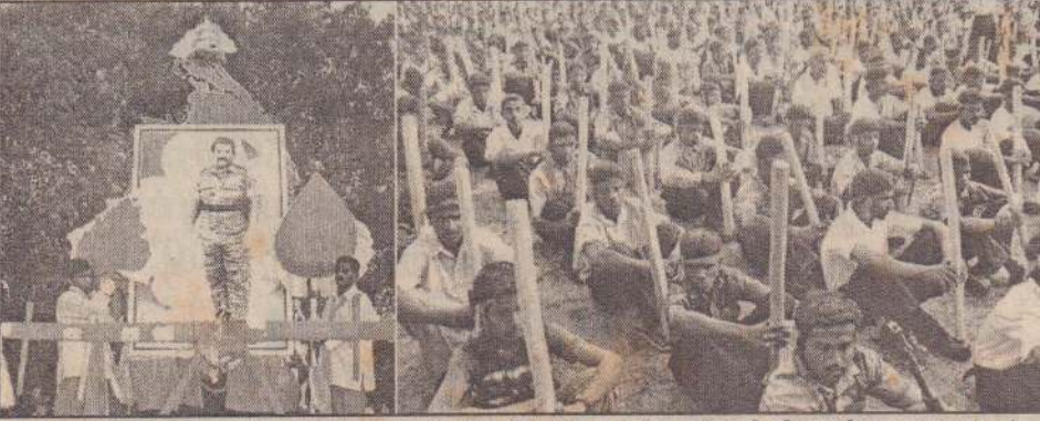
நேற்றுப் புதுக்குடியிருப்பில் நடைபெற்ற பொங்கு தமிழ் எழுச்சி நிகழ்வில் எடுக்கப்பட்ட மேலும் சில படங்கள் இவை.