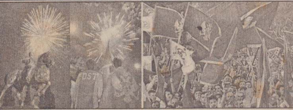
சேர்பியக் கூட்டமைப்பில் இருந்து விலகிய மொண்ட நிக்ரோ நேற்று தன்னை தனி நாடாகப் பிரகடனம் செய்தது. சும்பர் 6 லட்சம் பேர் இந்த நாட்டில் வசித்து வருவது குறிப்பிடத்தக்கது. தனிநாட்டுப் பிரகடனத்தை அடுத்து வாணவேடிக்கை மூலம் மகிழ்ச்சியை வெளிப்படுத்துகின்றனர் அந்நாட்டு மக்கள்.