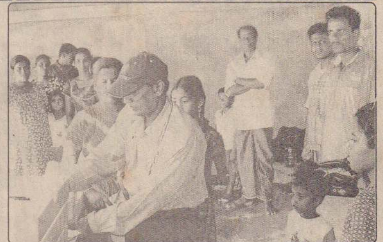
திருகோணமலையில் இருந்து இடம்பெயர்ந்து இந்தியாவிற்குச் சென்ற அகதிகளில் ஒரு பகுதியினர் படகோட்டிகளால் ஏமாற்றப்பட்டு, மன்னார் இலுப்பைக் கடலைப் பகுதியில் இறக்கிவிடப்பட்டனர். அங்கு தங்கவைக்கப்பட்டிருக்கும் அகதிகளுக்கு நல்லாழ்வு அபிவிருத்தி நிறுவனம் மருத்துவ வசதிகளை வழங்கும் போது எடுக்கப்பட்ட படம்.