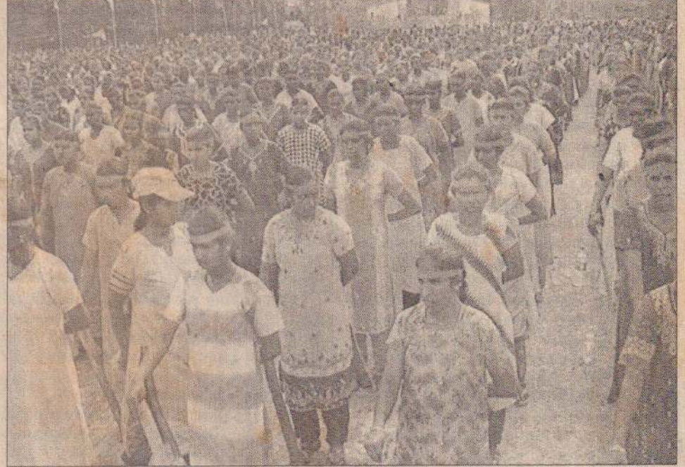
புதுக்குடியிருப்பில் நேற்று நடைபெற்ற பொங்குதமிழ் எழுச்சி நிகழ்வில் பெருமளவானோர் பங்குபற்றி தமிழ் உணர்வை வெளிப்படுத்தினர். தற்காப்புப் பயிற்சிபெற்ற பத்தாயிரம் பேர் இந்த நிகழ்வில் கலந்துகொண்டு தாம் பெற்ற பயிற்சியினை நிறைவுசெய்தனர்.

சிறைக்காவலர்கள் இருவர் கடமையில் இருந்தபோதும் அவர்கள் துப்பாக்கிகளை வைத்திருக்கவில்லை. இந்தச் சந்தர்ப்பத்தைப் பயன்படுத்திய சிறைக்கைதிகள் எட்டுப் பேர் தங்களிடமிருந்த கைத்துப்பாக்கி மற்றும் கைக்குண்டுகளைக் காட்டி சிறைக் (10ஆம் பக்கம் பார்க்க)