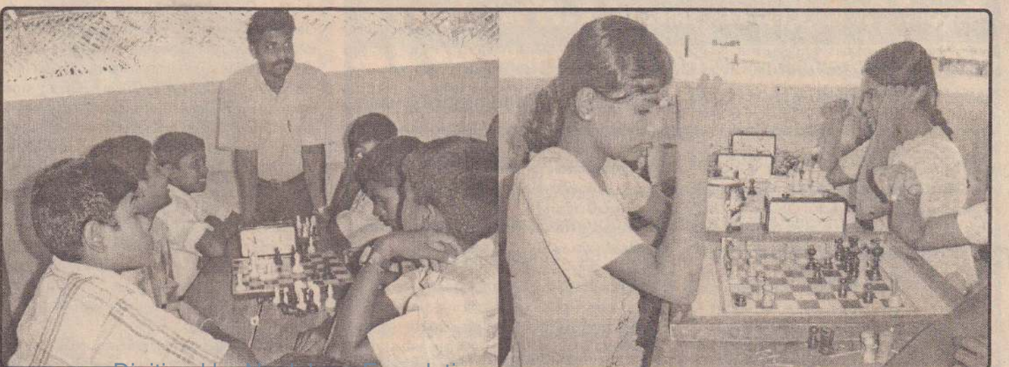
புதுக்குடியிருப்பு கிராமங்களில் அ.த.க.பாடசாலை மண்டபத்தில் முல்லைத்தீவு மாவட்ட மட்டத்தில் தெரிவாகிய சதுரங்க அணிகளுக்கான பயிற்சி நிகழ்வில் மீளவர்கள் பயிற்சியில் ஈடுபட்டபோது எடுக்கப்பட்ட படங்கள் இவை.

ஏனைய கிராமங்களுக்கும், மண்ணெண்ணை வழங்குவதற்கு நடவடிக்கை மேற்கொண்டது போன்று தவறவிடப்பட்ட கிராமங்களுக்கும் மண்ணெண்ணை வழங்குவதற்கு உரியவர்கள் ஆவன செய்யவேண்டும் என்றும்- விவசாயிகளால் வேண்டு கோள் விடுக்கப்பட்டது. (352)