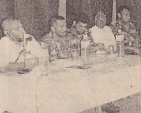
சமூகசேவை மற்றும் சமூக நலத்துறை அமைச்சர் டக்ளஸ் தேவானந்தா தீவகற்பகுதிக்கு அண்மையில் விஜயம் செய்து அங்குள்ள மக்களைச் சந்தித்தார். திகழ்வில் அமைச்சர் டக்ளஸ் தேவானந்தாவுடன் கடற்படை அதிகாரிகள் மற்றும் பொலீஸார் அமர்ந்திருப்பதைப் படத்தில் காணலாம்.

மாகக் குடித்து மகிழ்கின்றனர். அத்துடன், வீதிகளில் பயணம் செய்வோர் மீது போதையில் தகாத வார்த்தைகளைப் பிரயோகிக்கின்றனர். இதனால் இந்த வீதியில் பயணம் செய்யும் சிறுவர், பெண்கள் உட்பட பலரும் சிரமம் அடைகின்றனர். பல பிரதேசங்களுக்கு செல்லும் பிரதான வீதியில் இருந்து குடிசைகள் செய்யும் அட்டகாசத்தைக் கட்டுப்படுத்த உரியவர்கள் நடவடிக்கை எடுக்கவேண்டுமென கோரிக்கை விடுக்கப்பட்டுள்ளது. (204-70)