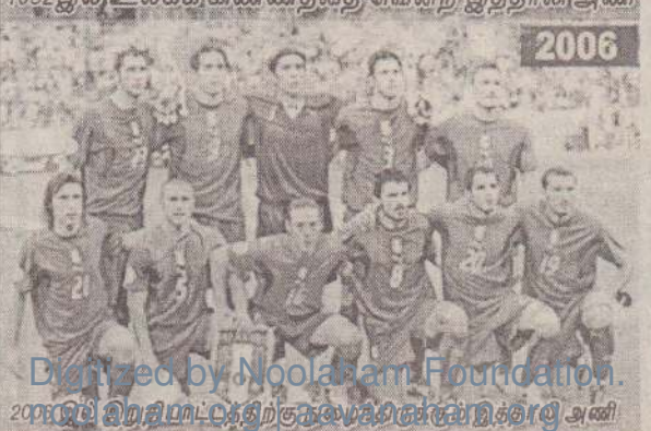
1982இல் உலகக் கிண்ணத்தை வென்ற இத்தாலி அணி