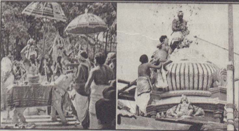
நெடுந்தீவு - பெருக்கடி சித்தி ஸீநாயகர் ஆலய மகாகும்பாடிஷேகம் அண்மையில் நடைபெற்றது. அந்தணர் சீவாசாரியர்கள் அபிஷேக கும்பங்களைச் சுமந்து வருவதை முதலாவது படத்திலும் ஸீமானத்திற்கு அபிஷேகம் செய்வதை அடுத்துள்ள படத்திலும் காணலாம்.