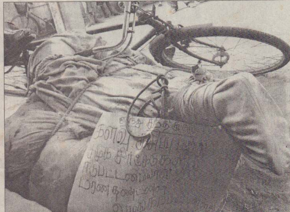
கொக்குவில் பகுதியில் மெத்தைக்குள் சுருட்டிக்கிடக்கப்பட்ட நிலையில் மீட்கப்பட்ட சடலத்தையும் அதில் கொலைக்கு உரிமை கோரி கட்டப்பட்டிருந்த அட்டையையும் படத்தில்