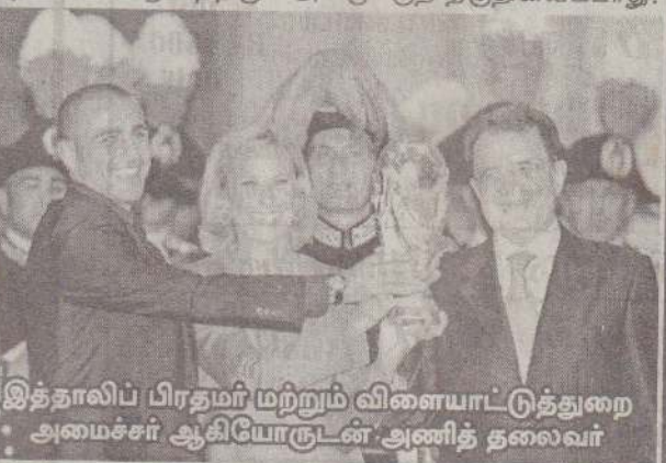
இத்தாலிப் பிரதமர் மற்றும் விளையாட்டுத்துறை அமைச்சர் ஆகியோருடன் அணித் தலைவர்

தங்கப் பந்து விருதுக்கான வீரரை 'பிபா' தேர்வு செய்வது கிடையாது. பத்திரிகையாளர்கள்தான் தேர்வு செய்கிறார்கள். ஆனாலும், விளையாட்டு மரபுகள் மீறப்படும்போது, அதில் தலையிடும் உரிமை 'பிபா' செயற்கு முடிவுக்கு உண்டு. ஜிடேன் செயல் மிகுந்தவனாக அளிக்கிறது. எந்த ஒரு பத்தகம் பெறுவதற்கும் அவருக்குத் தகுதிகிடையாது.