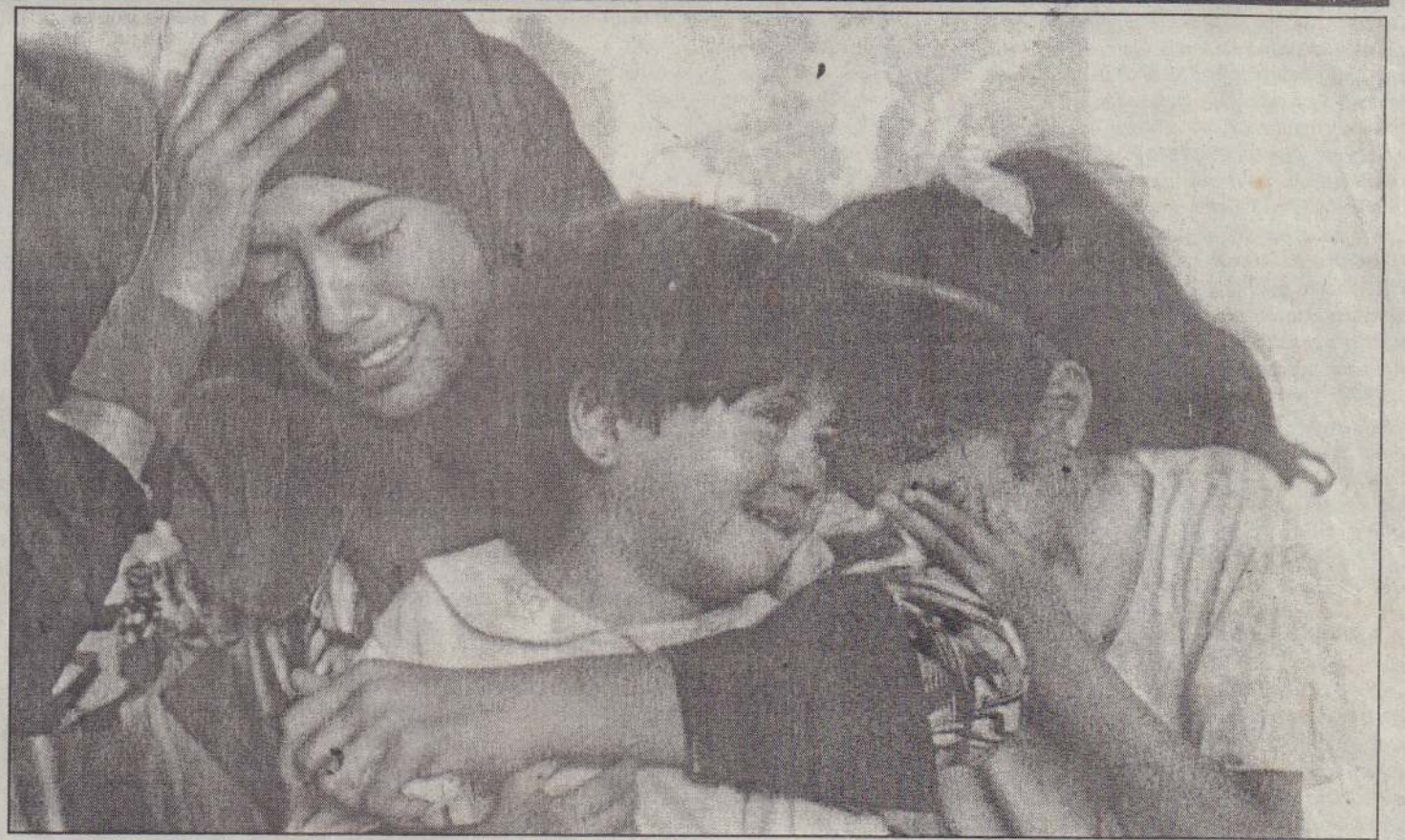
இஸ்ரேலிய விமான தாக்குதலில் தமது சகோதரன், தாய் மற்றும் சிலர் கொல்லப்பட்டு அடக்கம் செய்யப்பட்டபோது மூன்று பிள்ளைகள் கதறி அழும் காட்சி.

ரயில்களில் பிரயாணம் செய்யும் அப்பாவி பொதுமக்களை காரணம் இன்றி இலக்குவைத்துக் குண்டுகளால் தாக்குவதென்பது சர்வதேசத் தீவிரவாதத்தின் ஒரு போக்காகக் கருதப்படுகின்றது. காஷ்மீர் பிரச்சினை இந்தியா - பாகிஸ்தான் காஷ்மீர் மக்கள் ஆகிய முத்தரப்புக்குமிடையில் சுமுகமாகத் தீர்க்கப்படும்வரை காஷ்மீர் தீவிரவாதிகளின் நடவடிக்கைகளைக் கட்டுப்படுத்துவது சாத்தியமில்லைபோல் தெரிகின்றது.