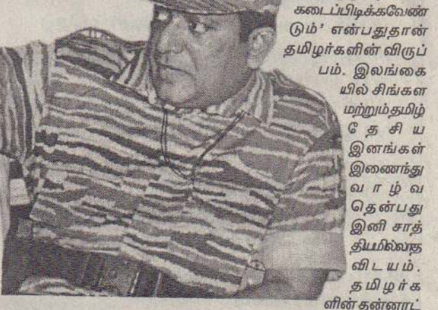
'இந்தியப் பிரதமர் மன்மையிலான்மத்திய பிரச்சினையில் அணுகுமுறையைக் கடைப்பிடிக்கவேண்டும்' என்பதுதான் தமிழர்களின் விருப்பம். இலங்கையில் சிங்கள மற்றும் தமிழ் தேசிய இனங்கள் இணைந்து வாழ்வதென்பது இனி சாத்தியமல்லாவிடயம். தமிழர்களின் தன்னாட்சித் திட்டத்தைச் செயற்படுத்த இந்தியா உதவவேண்டும் என்பதே அங்குள்ள தமிழர்களின் ஆசை. அதேசமயம் புலிகளைப் புறக்கணித்துவிட்டு இத்தகைய பேச்சுவார்த்தைகளை முன்னெடுப்பதில் பிரயோசனம் ஒன்றும் இல்லை. ஏனென்றால், இன்று புலிகள் மட்டும் தான் ஈழத்தமிழ் மக்களிடம் ஆதரவு பெற்ற ஒரே அமைப்பாக இருக்கிறார்கள் என்பதிலும் சந்தேகமில்லை.

இந்நிலையில், மோகன்சியத் தலை அரசு, இலங்கைப் பேரமையான