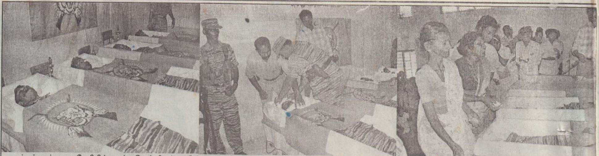
மட்டக்களப்பு வாகனேரியில் கடந்த வெள்ளியன்று வீரச்சாவடைந்த 4 போராளிகளின் வித்துடல்கள் புனித விதைகுழியில் விதைப்பதற்கு முன்பதாக கரடியனாறு மகா வித்தியாலயத்தில் மக்களின் அஞ்சலிக்காக வைக்கப்பட்டிருந்தன. மாவீரர்களின் வித்துடல்களை முதலாவது படத்திலும், வித்துடல்களுக்கு மாலை அணிவிக்கப்பட்டு அஞ்சலி செலுத்துவதை இரண்டாவது படத்திலும், மாவீரரின் தாயாரொருவர் மலர்தூவி அஞ்சலி செலுத்துவதை இறுதியாக உள்ள படத்திலும் காணலாம்.