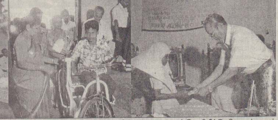
தியாகி அறக் கொடை நிலையத்தின் 'வைகறை' நூல் வெளியீட்டு விழாவும், அறக் கொடை வழங்கும் நிகழ்வும் நேற்றுமாலை நல்லூர் கலாசார மண்டபத்தில் நடைபெற்றன. இந்த நிகழ்வில் எடுக்கப்பட்ட படங்கள் இவை.