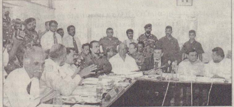
'ஜாதிக்க சலிய' எனும் அபிவிருத்தி செயற்றிட்டத்தின் கீழ் வன்னி மாவட்டத்தை அபிவிருத்தி செய்வது தொடர்பான கலந்துரையாடல் ஒன்று நேற்று முன்தினம் வவுனியா மாவட்ட செயலகத்தில் நடைபெற்றது.

றிணைத்து நாடாளுமன்றத்தில் சுயாதீனமாகச் செயற்படும் குழுவை உருவாக்குவதற்கும், அந்தக் குழுவின் தாரமிக ஆதரவை தேவைப்படும் வேளைகளில் அரசுக்கு வழங்குவதற்கும் ஆலோசிக்கப்பட்டிருப்பதாகத் தெரிவிக்கப்படுகிறது. ஐ.தே.க. சிரேஷ்ட உறுப்பினர் ஒருவரின் வழிகாட்டலின் கீழ் மேற்கொள்ளப்படும் இந்த செயற்பாடு குறித்து கட்சியின் சிரேஷ்ட உறுப்பினர்கள் சிலர் கட்சித் தலைமையிடம் சுட்டிக் காட்டியிருக்கின்றனர். இவர்கள் தொடர்பாக கடும் நடவடிக்கைகளை எடுப்பதற்குத் ஐ.தே.க. தலைமை தீயாராகி வருகிறது என்று கட்சியின் உள்வீட்டுத் தகவல்கள் தெரிவித்தன. (ஐ)