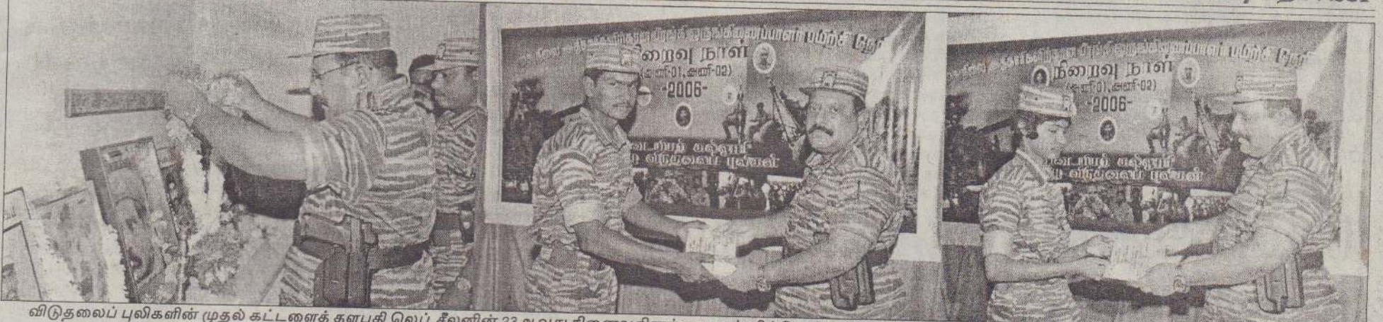
விடுதலைப் புலிகளின் முதல் கட்டளைத் தளபதி லெப். சீலனின் 23ஆவது நினைவுதினத்தை முன்னிட்டு ஏற்பாடு செய்யப்பட்ட நிகழ்வில் தேசியத் தலைவர் வே. பிரபாகரன் சீலனின் உருவப் படத்திற்கு மாலை அணிவிப்பதை முதலாவது படத்திலும் முதுநிலை அதிகாரிகளுக்கான பிரங்கி ஒருங்கிணைப்பு பயிற்சியைப் பெற்ற போராளிகள் இருவருக்கு முறையே சான்றிதழ் வழங்குவதையும் படங்களில் காணலாம்.

சுடர் 21 வள்ளுவர் ஆண்டு 2037 ஆடி 01 திங்கட்கிழமை (17.07.2006) UTHAYAN-A Lively National Tamil Daily கதிர் : 231