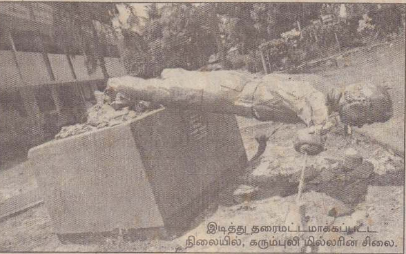
இடித்து தரைமட்டமாக்கப்பட்ட நிலையில், கரும்புலி மில்லரின் சிலை.

- இதேசமயம் - சங்கத்தின் ஏனைய கிளைகள் உடைக்கப்பட்டு பொருள்கள் களவாடப்படுவதைத் தவிர்ப்பதற்கு பொதுமக்கள் முன்வரவேண்டும் என்று சங்கம் கேட்டுள்ளது. (17)