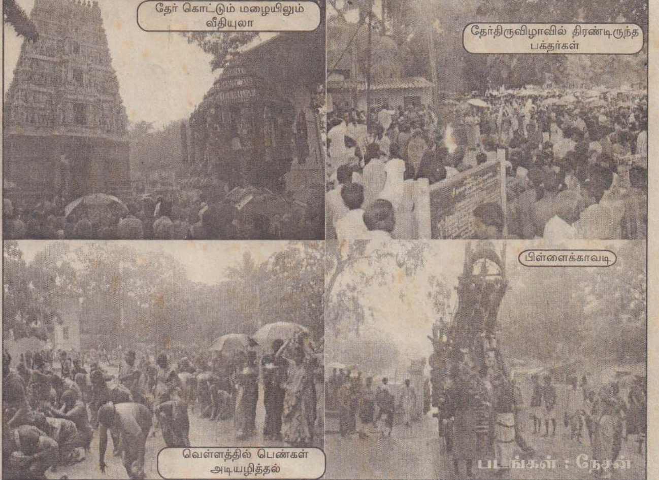
தேர் கொட்டும் மழையிலும் வீதியலா

ஆனால், தமிழர்களுக்கு எதிரான சீருடை அராஜகங்களின் விடயத்தில் இந்த நீதியான நிலைப்பாடு இல்லவே இல்லை என்பதுதானே கடந்த ஐந்து தசாந்தகால யதார்த்தம்! 'மஹிந்த சிந்தனை'யிலும் அதற்கு இடமில்லை என்பதும் இப்போது நிஜத்தில் நிரூபணமாகி வருகின்றது. அவ்வளவே.