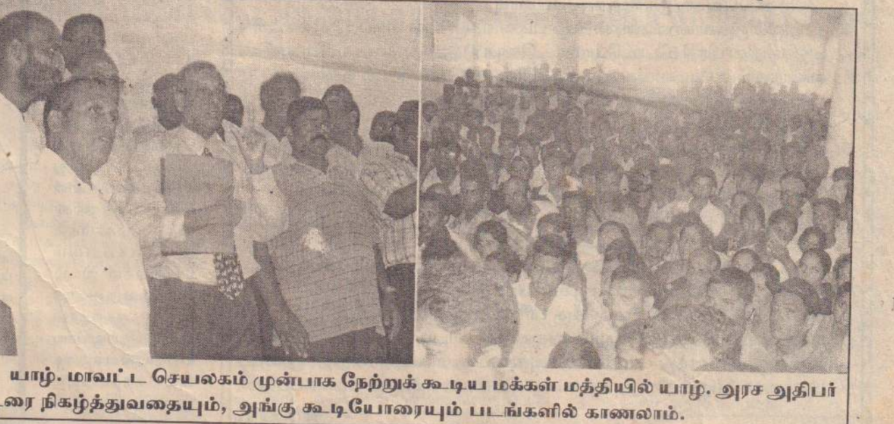
யாழ். மாவட்ட செயலகம் முன்பாக நேற்றுக் கூடிய மக்கள் மத்தியில் யாழ். அரச அதிபர் உரை நிகழ்த்துவதையும், அங்கு கூடியோரையும் படங்களில் காணலாம்.