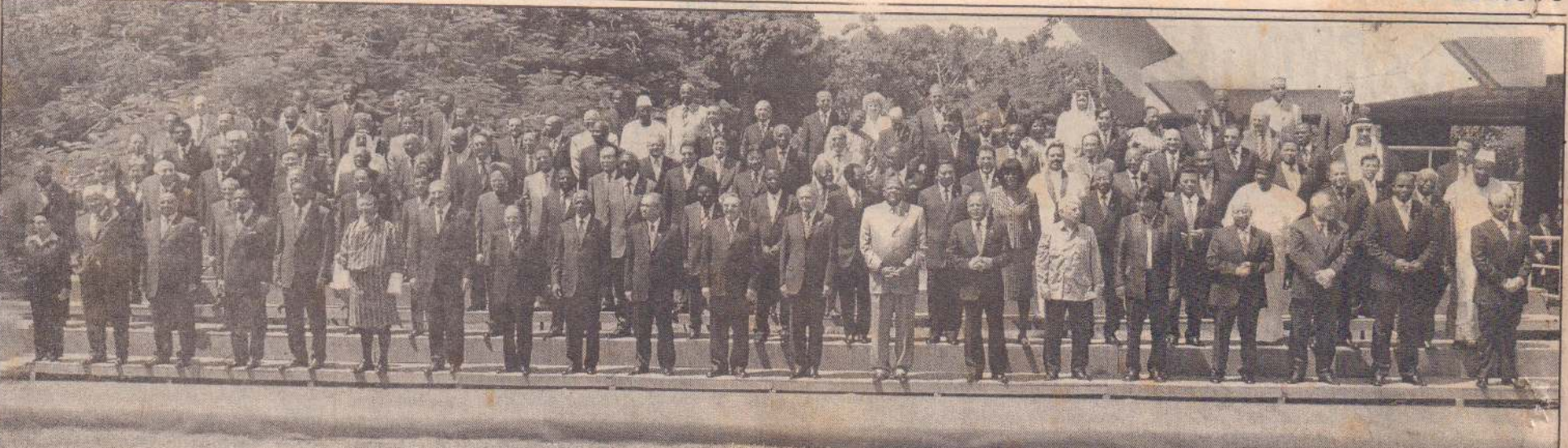
அணிசேரா நாடுகளின் மாநாட்டில் கலந்து கொள்ள கியூபா சென்றிருந்த நாடுகளின் தலைவர்கள் இணைந்து எடுத்துக் கொண்ட படம் இது.