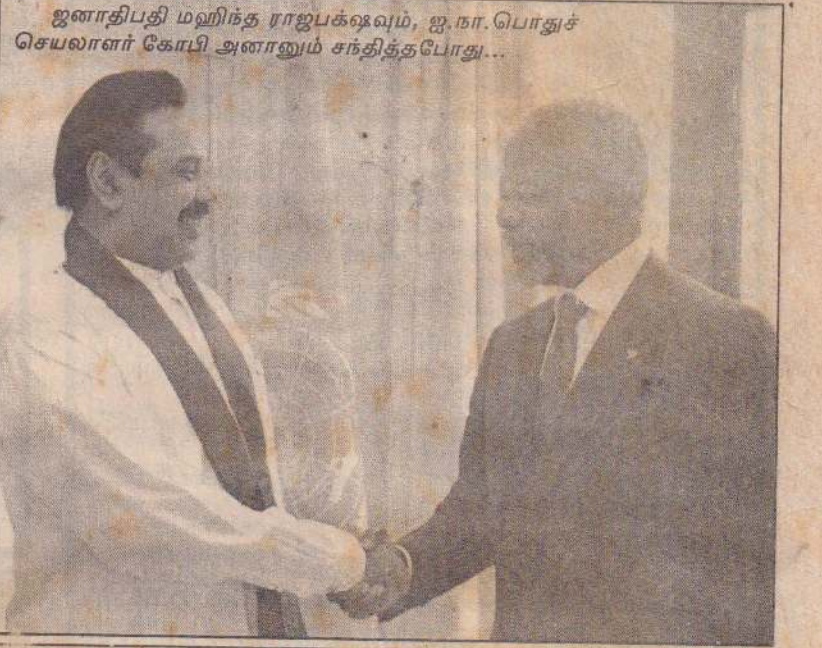
ஐனாதிபதி மஹிந்த ராஜபக்சவும், ஐ.நா.பொதுச் செயலாளர் கோபி அனானும் சந்தித்தபோது...

அணிசேரா நாடுகளின் மாநாட்டில் கலந்துகொண்டிருக்கும் ஐனாதிபதி மஹிந்த ராஜபக்ச நேற்று ஐ.நா. செயலர் கோபி அனானைச் சந்தித்துப் பேசியுள்ளார். இந்தச் சந்திப்பின் போது இலங்கையின் தற்போதைய நிலைவரம் குறித்து ஐனாதிபதி மஹிந்தராஜபக்ச, கோபி அனானுக்கு விளக்கமளித்தார் என்று ஐனாதிபதி செயலகம் நேற்றுத் தெரிவித்தது. தற்போது நடைபெறும் மோதல்கள் விடுதலைப் புலிகளின் தாக்குதல்களைத் தடுப்பதற்கான படையினரின் தாக்குதல்களே தவிர போர் அல்ல என்று ஐனாதிபதி, ஐ.நா. செயலரிடம் எடுத்துக் கூறினார். மோதல்கள் நடைபெறும் பகுதிகளுக்குச் செல்வதற்கு சர்வதேச அங்கீகாரம் பெற்ற தொண்டு நிறுவனங்களுக்கே அனுமதி வழங்கப்பட்டுள்ளது. செஞ்சிலுவைச் சர்வதேசக்குழு. (08 ஆம் பக்கம் பார்க்க)