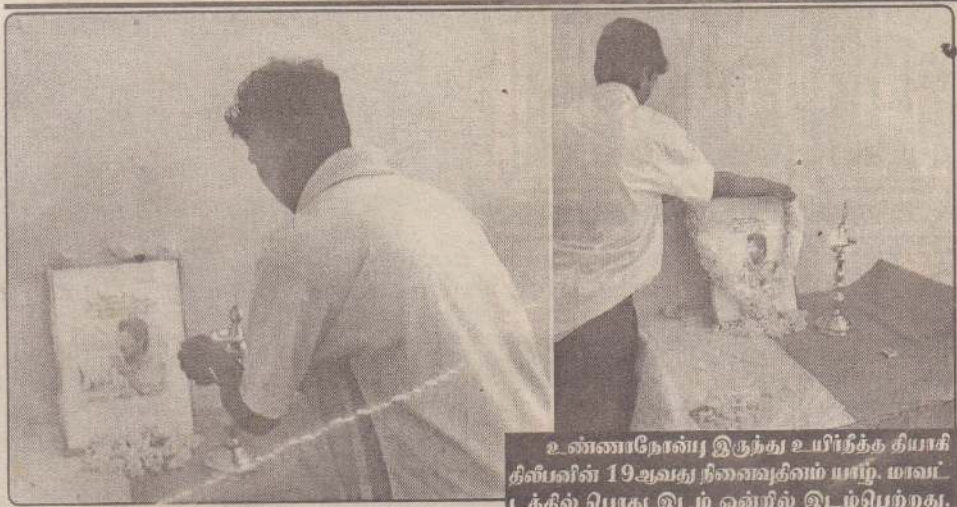
உண்ணாநோய் இருந்து உயிர்நீத்த தியாகி தின்பின் 19ஆவது நினைவுதினம் யாழ். மாவட்டத்தில் பொது இடம் ஒன்றில் இடம்பெற்றது. நிகழ்வில் தின்பின் திருவுருவம் படத்திற்கு சகச்சகடர் ஏற்றுவதையும் மாலை அணிவீர்ப்பு வையும் படங்களில் காணலாம்.