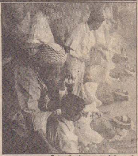
அம்பாறையில் இன்று ஹர்த்தால் விடுதலைப் புலிகள் அழைப்பு

பிடிக்கப்பட்டிருக்கின்றன. கொலையுண்டவர்களின் கண்கள், கைகள் கட்டப்பட்ட நிலையில் காணப்பட்டன. பத்து சடலங்கள் வாவிக்கரையோரத்திலும், ஒரு சடலம் சற்றுத் தொலைவில் பற்றை மறை (08 ஆம் பக்கம் பார்க்க)