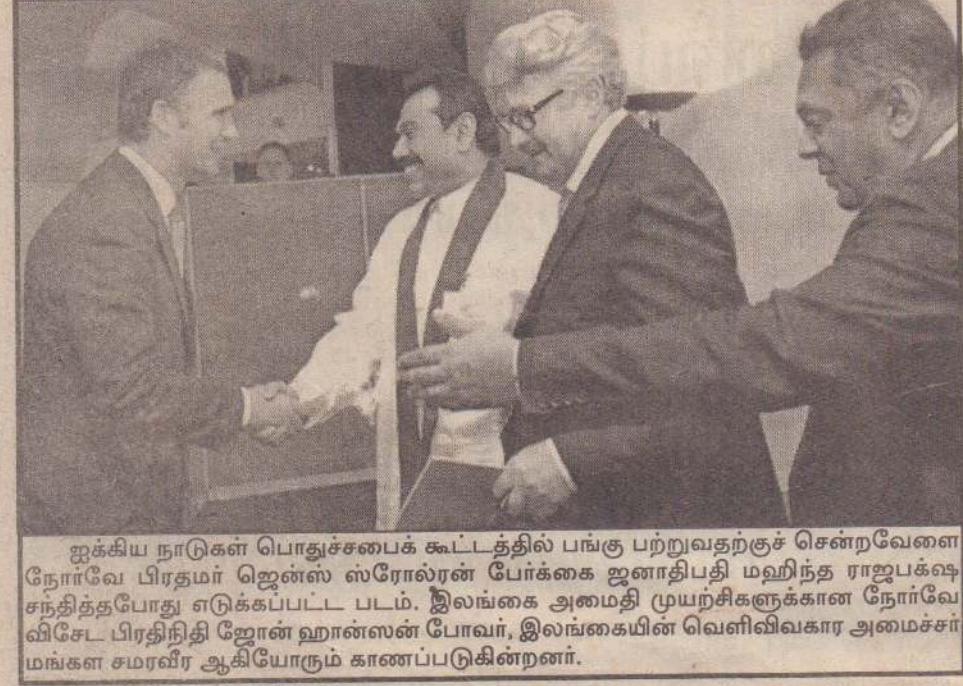
ஐக்கிய நாடுகள் பொதுச்சபைக் கூட்டத்தில் பங்கு பற்றுவதற்குச் சென்றவேளை நோர்வே பிரதமர் ஜென்ஸ் ஸ்ரோல்ரன் பேர்க்கை ஜனாதிபதி மஹிந்த ராஜபக்ஷ சந்தித்தபோது எடுக்கப்பட்ட படம். இலங்கை அமைதி முயற்சிகளுக்கான நோர்வே விசேட பிரதிநிதி ஜோன் ஹான்ஸன் போவர், இலங்கையின் வெளிவிவகார அமைச்சர் மாண்கள் சமரவீர ஆகியோரும் காணப்படுகின்றனர்.