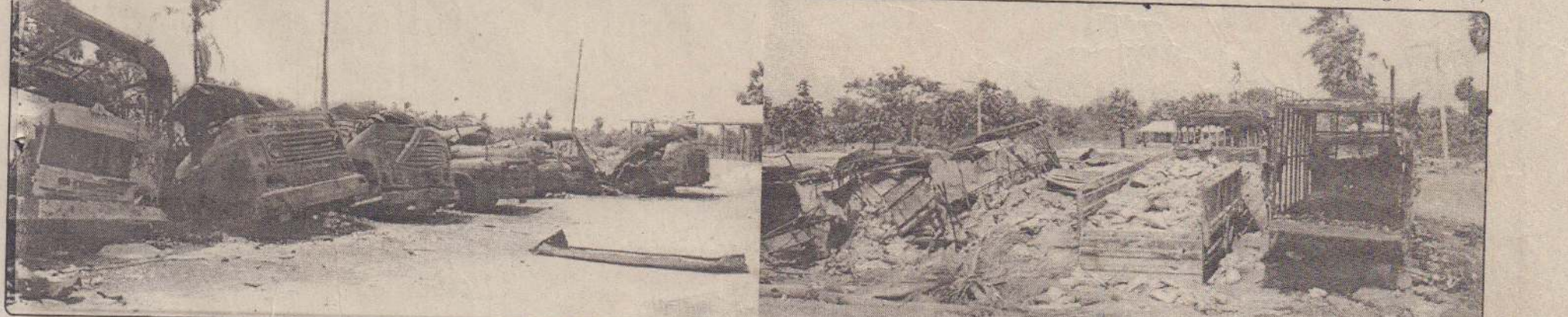
கடந்த மாதம் 10 ஆம் திகதி முகாமலையில் நிறுத்தப்பட்ட வாகனங்களில் இருந்து தாக்குதல்கள் எரிந்து பல்வகை சேதத்திற்கு உள்ளாகிய செய்தி கடந்த செவ்வாயன்று உதயனில் வெளிச்சாய்ந்து தெரிந்ததே. எரிந்த லொரிகளையே மேலே உள்ள படங்களில் காண்கிறீர்கள். www.aavanaham.org | aavanaham.org

எனவே, நாளை பொழுதை எதிர்கொள்ளச் சக்தியற்று எதிர்காலத்தைக் கேள்விக்குறியோடு நோக்கி நிற்கும் எமது கிராமத் தொழிலாளர்களுக்கான ஒரு தனி நிவாரண உதவித் திட்டம் பற்றிய வழியினை ஏற்படுத்தி எமக்கு உதவ ஆவன செய்வதோடு எமது தொழிலாளர் தொழில் புரிவதற்குரிய புறச் சூழலை ஏற்படுத்தித் தரும் வண்ணம் தங்களை மிகவும் தாழ்மையுடன் கேட்டுக் கொள்கின்றோம். - என்றுள்ளது. (ப-203)