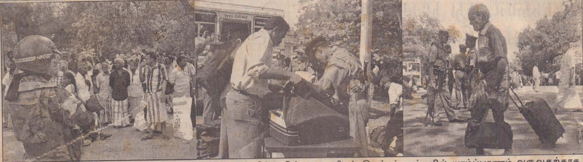
போக்குவரத்துத் தடைப்பட்டதால் வவுனியாவில் அந்தரித்து நின்ற பயணிகள் இவர்கள். கப்பலில் யாழ்ப்பாணம் வருவதற்காக நேற்றுக்காலை வவுனியாவிலிருந்து பஸ்களில் இவர்கள் திருகோணமலைக்கு அழைத்துச் செல்லப்பட இருந்தமையம் எடுக்கப்பட்ட படங்கள்.