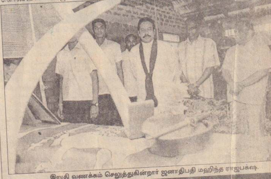
இறுதி வணக்கம் செலுத்துகின்றார் ஜனாதிபதி மஹிந்த ராஜபக்ஷ.

விடுத்த அறிக்கையில் தெரிவிக்கப்பட்டுள்ளது. ஜனாதிபதியின் பாதுகாப்புப் பிரிவினரால் விடுக்கப்பட்ட ஆலோசனைகளையும் கருத்திற் கொள்ளாது ஜனாதிபதி இந்த விஜயத்தை மேற்கொண்டார் என தெரிவிக்கப்பட்டது. இறுதிச்சடங்கில் உரையாற்றிய அவர், பின்தங்கிய கிராமங்களில் இருந்து படையில் சேர்ந்த இளைஞர்கள் நாட்டுக்காக தம் உயிரைத் தியாகம் செய்துள்ளனர் எனத் தெரிவித்தார். (1)