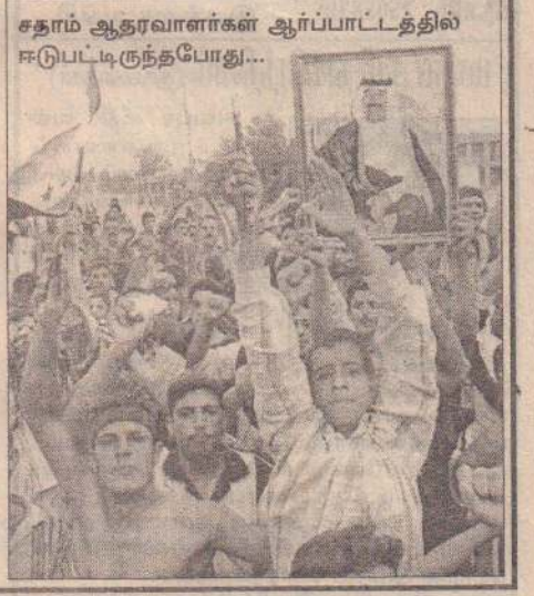
சதாம் ஆதரவாளர்கள் ஆர்ப்பாட்டத்தில் ஈடுபட்டிருந்தபோது...

தீர்ப்பு வழங்கப்பட்டபோது ஆவேசமாகக் காணப்பட்ட சதாம், தீர்ப்பளித்த பின்னர் 'அல்லாஹ் அக்பர்' (அல்லாஹ் பெரியவன்) என உரத்துக் கோஷமிட்டார். "ஈராக்கின் நாடு நீடுழி வாழ்க. அங்குள்ள மக்கள் நீடுழி வாழ்க" என்றும் அவர் கூச்சலிட்டார். "மரணதண்டனைக்கு நான் பயப்படவில்லை. துக்கில் போடுவதை விட என்னைத் துன்பாக்கியால் சுட்டுக்கொல்லுவதையே விரும்புகிறேன்" என்றும் ஆவேசமாகக் கூறினார் சதாம். (06ஆம் பக்கம் பார்க்க)