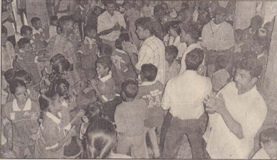
யாழ். சமூக செயற்பாட்டு மையம் பருத்தித்துறையில் உள்ள சிறுவர் கழகங்களை இணைத்து சிறுவர் சங்கம் நிகழ்வொன்றை தும்பளை லூர்த்து மாதா ஆலயத்தில் நடத்தியது. இந்நிகழ்வில் கலந்துகொண்ட சிறுவர்கள் ஆடிப்பாடி மகிழ்வதைப் படத்தில் கணாலாம். (115)

உரியவர்கள் இவ்விடயத்தில் கவனமெடுத்து இதற்குரிய நடவடிக்கைகளை எடுக்க முன்வர வேண்டும் என்று விவசாயிகள் கேட்டுள்ளனர்.