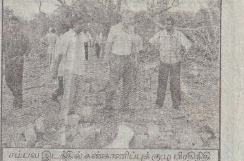
சம்பவ இடத்தில் கண்காணிப்புக் குழு பிரதிநிதி