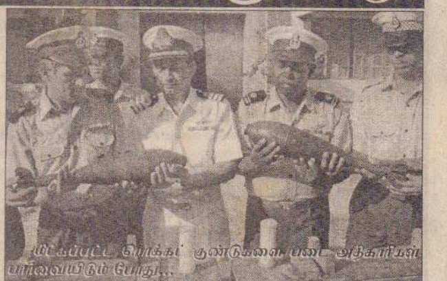
மீட்கப்பட்ட றொக்கெட் குண்டுகளை படை அதிகாரிகள் பார்வையிடும் போது...

அதற்கு முதலில் - கடந்தவாரம் இராமேஸ்வரம் பகுதியில் மீன்பிடித்துக் கொண்டிருந்த மீனவர்களின் வலையில் முதல் (06ஆம் பக்கம் பார்க்க)