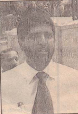
இங்கு அவரது செவ்வியை முழுமையாகத் தருகிறோம்.

யுத்த நிறுத்த ஒப்பந்தத்தின் 1.1. சரத்தில் தெளிவாக ஏ-9 பாதை திறக்கப்பட வேண்டும் என்று கூறப்பட்டுள்ளது. அதனை அரசாங்கம் விரும்பவில்லை எனில் யுத்த நிறுத்த ஒப்பந்தத்தை ஏற்கவில்லை என்று