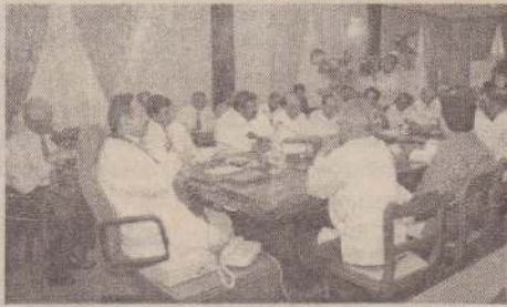
கொழும்பு, டி.செ. 20

தோட்டத் தொழிலாளருக்கு நாளொன்றுக்கு 260 ரூபா சம்பளம் வழங்கும் ஒப்பந்தம் நேற்று ஜனாதிபதி மஹிந்த ராஜபக்ஷ முன்னிலையில் தொழிற்சங்கங்களுக்கும், முதலாளிமார் சம்மேளனத்துக்கும் இடையில் கைச்சாத்தானது.