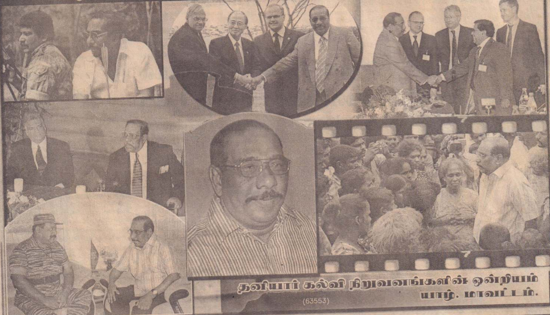
தனியார் கல்வி நிறுவனங்களின் ஒன்றியம் யாழ். மாவட்டம். (63553)