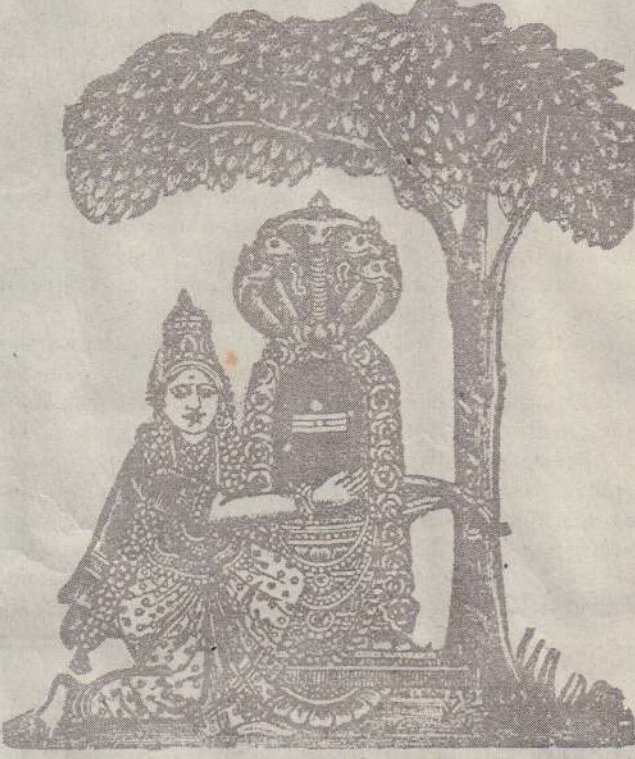
வில்வ மரத்தாளை வெவ்வினைகள் களைவானை அல்லும் பகலும்மெங்கள் தொல்வையற அருள்வானை பொல்லா வினையகல புங்கங்குளத்தூர் புகுந்து கல்லும் கசிற்துருக பாவிகள் நாம் பணிந்திருவோம்.

அழகிய பெருந்தெரு, அதனை அண்டியிருக்கும் ஒரு புனிதமான குச்சொழங்கை, அறிவும் ஆற்றலும் தெய்வீகமும் நிரம்பியிருக்கும் மக்கள் சூழ்ந்த அயல். இத்தனைக்கும் நடுவிலே அமைந்திருக்கும் அற்புத மரத்தோப்புக்கள். இதிலே உயர்ந்து ஓங்கி வளர்ந்திருக்கிறது அம்மனுக்குப் பிடித்தமான ஒரு வில்வமரம். இந்த மரத்தின் அடியிலேதான் அம்பாளின் வதிவிடம் தென்படலாயிற்று. அக்காலத்தில் இந்த வளவுக்குள் குடியிருந்த அடியவர்கள் அம்மனின் அருளையும் அருட்தோற்றத்தையும் அற்புதங்களையும் பல தடவைகள் கண்டு வியந்து தெய்வீக மேலீட்டினால் அந்த இடத்திலே சிறியதோர் ஆலயத்தை அமைத்து ஆராதிக்க முற்படலாயினர். காலப்போக்கிலே அயலவர்களும் அண்டி வாழ்பவர்களும் அம்பாளின் அற்புதங்களினால் அம்பாள் அடியார்களாயினர். யாழ்ப்பாணம், புங்கங்குளம் பகுதியிலே வில்வ மரத்தடியிலே அம்பாளின் வதிவிடம் மிகச் சிறிய தாளாலும் அம்பாளின் அற்புதங்களினால் இந்த ஆலயம் தெய்வீக நிலையினால் மிகமிக மேலோங்கியுள்ளமை குறிப்பிடத்தக்க விடயம்.