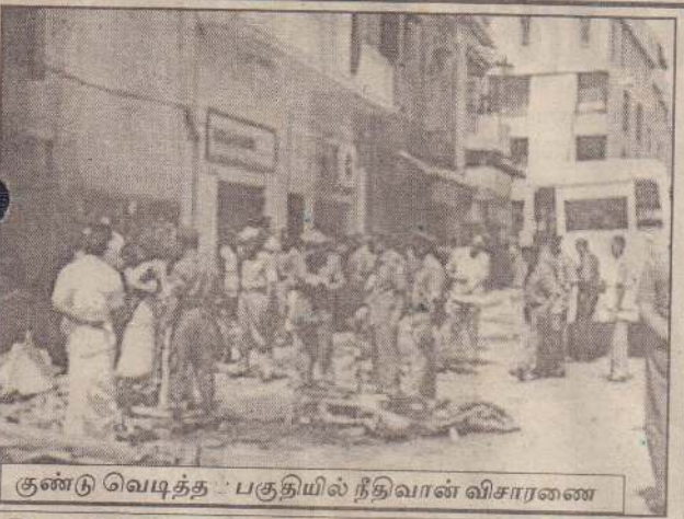
குண்டு வெடித்த பகுதியில் நீதிவான் விசாரணை

விடுதலைப் புலிகள் 18 படகுகளில் வந்து தாக்குதல்களை நடத்தியுள்ளனர். இவற்றில் 6 படகுகள் தற்கொலை குண்டுதாரிகளைக் கொண்ட படகுகள் என்று தற்போது தெரியவந்துள்ளது. (05ஆம் பக்கம் பார்க்க)