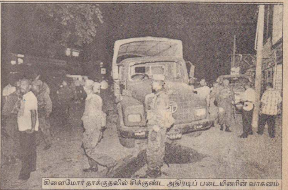
கிளைமோர் தாக்குதலில் சிக்குண்ட அதிரடிப் படையினரின் வாகனம்

உடுப்பிட்டி, மே 29 வதிரிப் பகுதியில் நேற்று மாலை 4 மணியளவில் படையினர் திடீரென சுற்றிவளைப்புத் தேடுதல் ஒன்றை நடத்தினர். இத் தேடுதலின்போது ஒருவர் கைது செய்யப்பட்டதாகக் கூறப்பட்டது. அந்தப் பகுதியில் நேற்றிரவு பதற்ற மரண நிலை காணப்பட்டது. (அ-1-155)