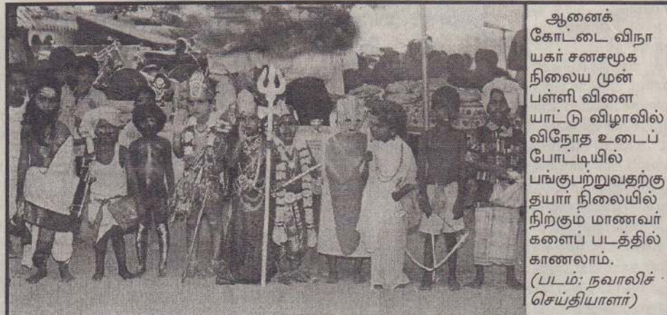
ஆணைக் கோட்டை விநாயகர் சனசமூக நிலைய முன்பள்ளி விளை யாட்டு விழாவில் விநோத உடைப் போட்டியில் பங்குபற்றுவதற்கு தயார் நிலையில் நிற்கும் மாணவர்களைப் படத்தில் காணலாம்.