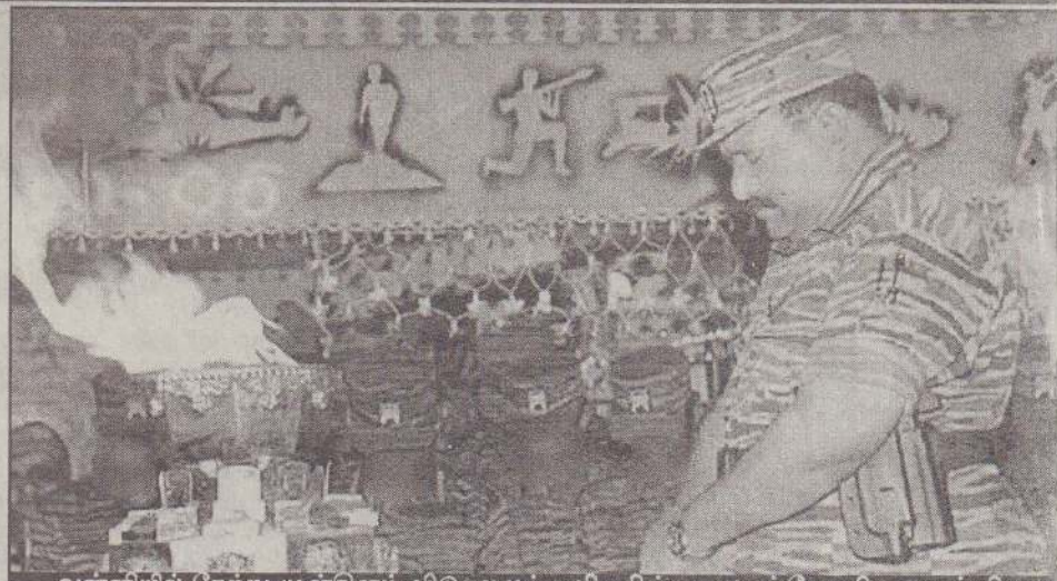
வன்னியில் நேற்று முன்தினம் விடுதலைப் புலிகளின் தலைவர் வே. பிரபாகரன் நினைவுச் சடர் ஏற்றி சரும்புலிகளுக்கு அஞ்சலி செலுத்துவதைப் படத்தில் காணலாம்.