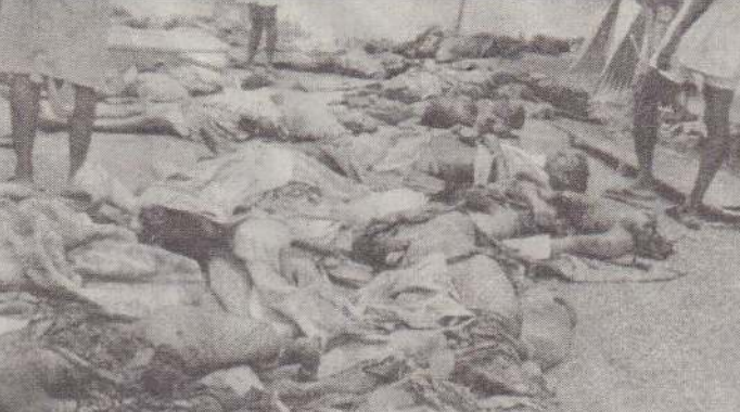
நவாலியில் படுகொலை செய்யப்பட்ட அப்பாவி மக்களின் சடலங்கள்.

குடாநாட்டின் பல்வேறு இடத்தைச் சேர்ந்தவர்கள் - பலியாகினர். இக் கொடூரச் சாவை, கையிழந்து, காலிழந்து, தலையிழந்து, உடல்சிதறி குற்றுயிராகக் கிடந்த நிகழ்வுகளை எம்மால் மறந்து விட முடியாது. சுமார் 360 இற்கும் மேற்பட்டோர் காயமடைந்தனர். சிகிச்சை அளிக்காத நிலையில் நீண்ட நேரம் இரத்தம் சிந்திப் பலர் உயிர் இழந்ததைக் காணக்கூடியதாக இருந்தது. அன்றைய தாக்குதல் சம்பவங்களுக்கிடையேயும் பொதுமக்கள் சேவையில் நேரடியாகப் பங்கு கொண்ட வலி. தென்மேற்கு சண்டிவிப்பாய் பிரதேச செயலர் பிரிவைச் சேர்ந்த இரு கிராம அலுவலர்களான நாவலி வடக்கு பிரிவு அலுவலர், சில்லாலைப் பிரிவு கிராம அலுவலர் மற்றும் ஸ்தலத்தில் பலியான அரச சேவையாளர்கள் ஆகியோரை எவராலும் மறக்கவே முடியாது.