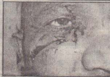
லண்டன், ஜூலை 7