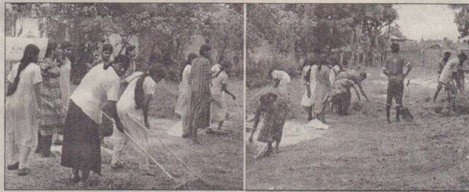
சேவாலங்கா நிறுவனம் நடத்திய பொதுச் சுகாதார மேம்பாட்டு நிகழ்வையொட்டி கரவெட்டி ஸ்ரீபரமானந்த ஆச்சிரமத்தில் அண்மையில் சிரமதானப் பணி மேற்கொள்ளப்பட்டது. அதன்போது எடுக்கப்பட்ட படங்கள் : சந்திர

விலை நிர்ணயம் செய்யப்படாத நிலையில் பற்றுச்சீட்டை சங்கத்தினர் எதற்காக வழங்கினர் என நுகர்வோர் கேள்வி எழுப்புகின்றனர். (202-70)