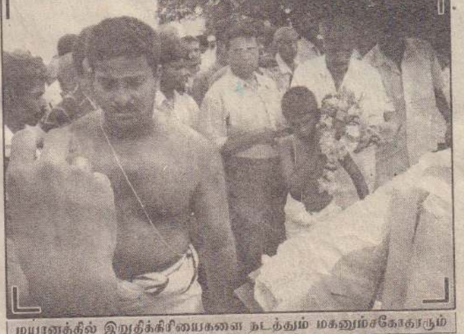
மயானத்தில் இறுதிக்கிரமங்களை நடத்தும் மகனும்கோகாரும்