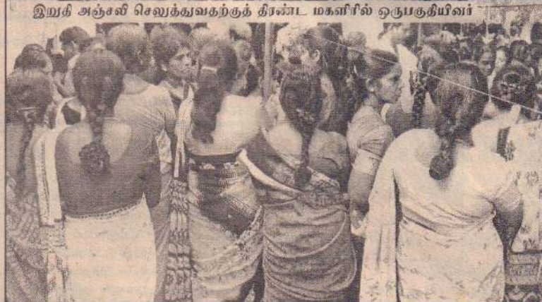
இறுதி அஞ்சலி செலுத்துவதற்குத் தீர்மானம் மகனில் ஒருபகுதியினர்