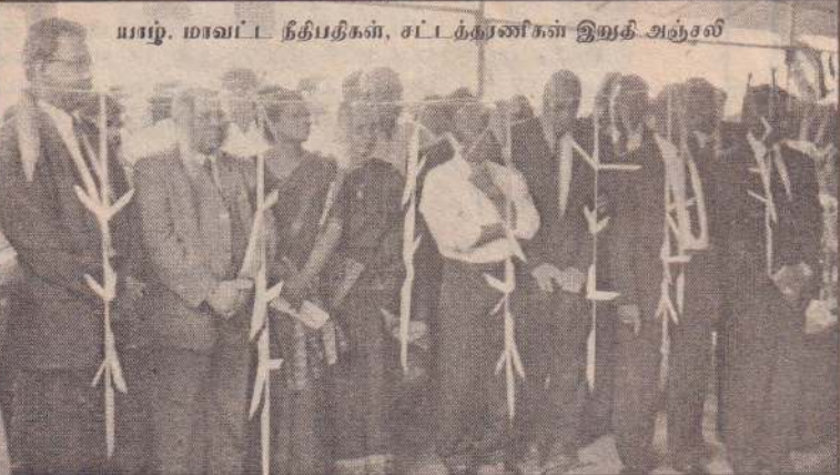
யாழ். மாவட்ட நீதிபதிகள், சட்ட கருணிகள் இறுதி அஞ்சலி