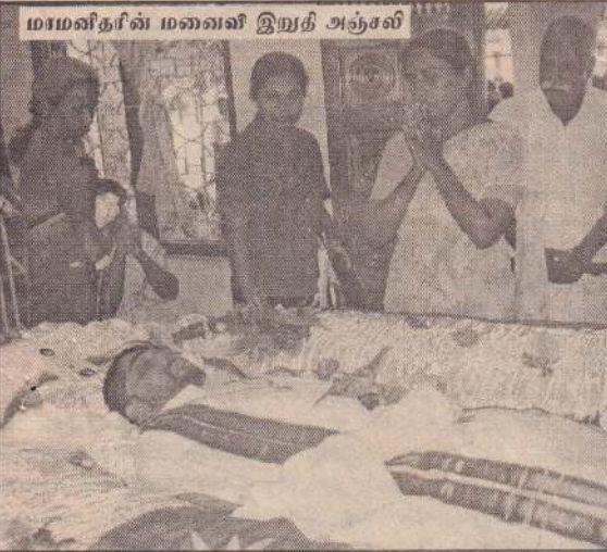
மாமனிதரின் மனைவி இறுதி அஞ்சலி