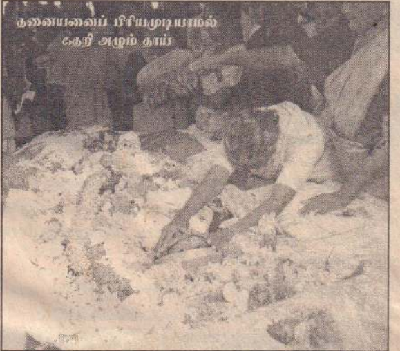
குணையவைப் பிரியமுடியாமல் கெழி அழும் தாய்