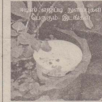
ஈடிபிடி நுளம்புகள் பெருகும் இடங்கள்

மீன் தொட்டிகள் வெறுமையாக்கப்படவேண்டும். தேங்காய்ச் சிரட்டைகளில் நீர் தேங்கி நிற்காத வகையில் சேகரித்து களஞ்சியப் படுத்தி வைக்க வேண்டும். நீர் சேகரிப்புக்குப் பயன்படுத்தப்படும் பாத்திரங்கள், நீர்த் தாங்கிகள் என்பன அடிக்கடி வெறுமையாக்கப்பட்டு மீண்டும் நிரப்பப்பட வேண்டும். குளிர்