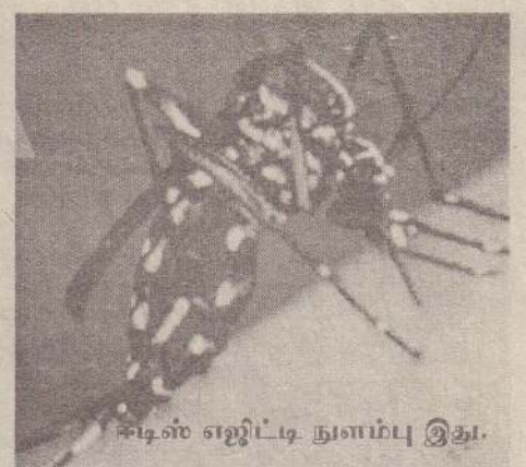
ஈடிபிடி நுளம்பு இது. இவற்றின் பெருக்கத்தை கட்டுப்படுத்தலாம். மழைகாலம் ஆரம்பிப்பதற்கு முன் தேவையற்ற சிறிய கொள்கலன்களைப் புதைத்தல், அழித்தல், கழிவுநீர்த் தேக்கங்களை துப்புரவு செய்தல் அவசியம். மீன்கள் அற்ற

எமது சுற்றுப்புறச் சூழலில் நுளம்புகள் பெருகும் கிடங்கள் நுளம்புகளில் பல நுற்றுக்கணக்கான இனங்கள் உண்டு. அனைத்துமே தம் முட்டைகளை நீரில் இடுகின்றன. முட்டைகள் பொரித்து குடும்பிகளாகிப் பின் புழுக்களாக வெளிவந்து 7-10 நாட்களில் முதிர்ந்த நுளம்புகளாக வளர்ச்சியடைகின்றன. ஆனால், நுளம்புகள் இனங்களுக்கு ஏற்றவாறு அவை முட்டையிடும் நீரும் வேறுபடும். ஈடிபிடி இன நுளம்புகள் சிறிய அளவில் சேர்ந்திருக்கும் நீரிலேயே தம்