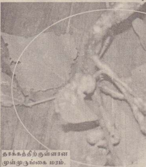
தாக்கத்திற்குள்ளான முள்முருங்கை மரம்.

மாற்றாகவும் கிளிற்சிடியாவைப் பயன்படுத்தலாம். கிளிற்சிடியா ஒரு பல்பயன்தரும் மரங்களுள் ஒன்று. உயிர் எரிபொருளாகவும் (Biofuel) சிறந்த பசுந்தான் பசுனையாகவும் பயன்படுகிறது. வேலிகளில் நடுவதற்கும் கால்நடைத் தவணமாகவும் பயன்படுத்தப்படுகிறது. மண்ணினுள் தழைச்சத்தை பதிக்கும் தன்மை மூலம் மண்வளத்தை பெருக்கவும் பயன்படுகிறது. முடிச்சுக்குளவியின் ஆதிக்கத்தைக் கட்டுப்படுத்த, பரவும் வீதத்தை குறைத்தல் முள்முருங்கைத்திற்குப் பதிலாக கிளிற்சிடியாவைப் பயன்படுத்தலாம். நாம் எல்லோரும் இணைந்து பாதினியம் என்ற களையைக் கட்டுப்படுத்த எங்கள் முயற்சித்தோமோ அதுமே முடிச்சுக்குளவியையும் விரைந்து கட்டுப்படுத்த வேண்டும்.