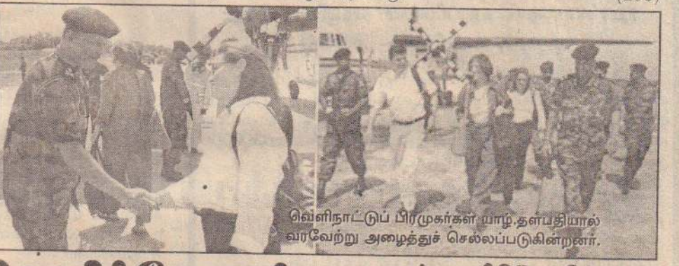
வெளிநாட்டுப் பிரிவுகர்கள் யாழ்.தளபதியால் வரவேற்று அழைத்துச் செல்லப்படுகின்றனர்.

பின்னர் இவர்கள் யாழ். பிரதேச அரசாங்க அதிகாரிகள், அரசாங்கப் பற்ற நிறுவன பிரதிநிதிகள் ஆகியோரைச் சந்திப்பதற்காக இராணுவத் தலைமையகத்திலிருந்து புறப்பட்டுச் சென்றனர். என்று தெரிவிக்கப்பட்டுள்ளது. (203)