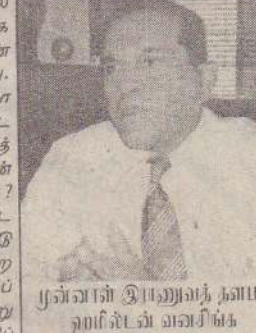
முன்னாள் இராணுவத் தளபதி ஹமிட் ஷாஹி சிங்க