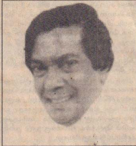
அதன் பின்னர் ஒரு முடிவை எடுக்கலாம் என்று ரணில் கூறினார். இதனை சபாநாயகர் நிராகரித்துவிட்டார். இந்த ஐந்து சட்டமூலங்களும் ஏற்கனவே அங்கீகரிக்கப்பட்டு விட்டன. மீண்டும் வாக்கெடுப்பு என்ற பேச்சுக்கே இடமில்லை. எனது தீர்ப்பை மாற்ற முடியாது என சபாநாயகர் கூறிவிட்டார். (சி)