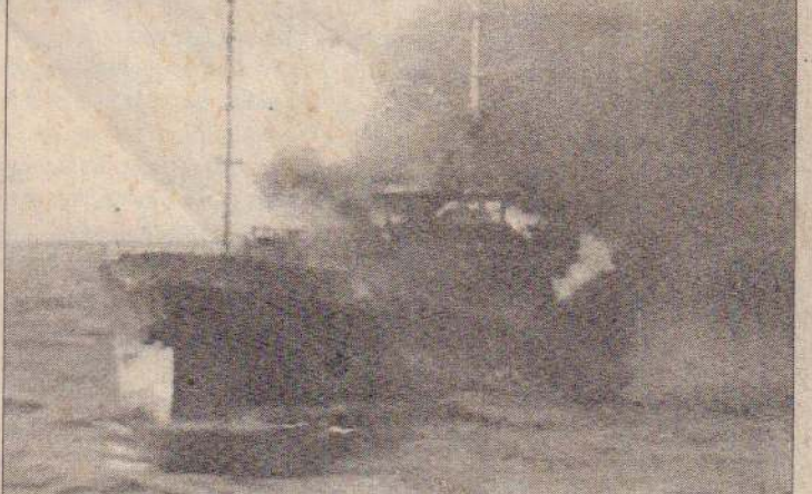
எரியும் கப்பல் ஒன்று குறித்து பாதுகாப்புத் தரப்பு வெளியிட்ட படம்.