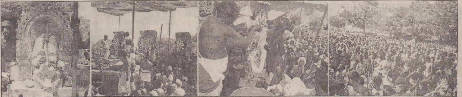
சரித்திரப் பிரசித்திபெற்ற ஸ்ரீ வல்லிபுர ஆழ்வார் சமுத்திர தீர்த்தத் திருவிழா புதனன்று நடைபெற்றபோது எடுக்கப்பட்ட படங்கள். 1) கடலில் தீர்த்தம் எடுப்பதற்குத் தயாராகின்றார் ஆஞ்சநேயர் 2) பாமா, ருக்மணி சகிதம் தீர்த்தம் ஆடுவதற்காக வல்லிபுர ஆழ்வார் பந்தலில் அமர்ந்து காட்சி தருகிறார். 3) கடல் தீர்த்தத்தால் சக்கர ஆழ்வார் நிராட்டப்படுகிறார். 4) தீர்த்த உற்சவத்தில் கலந்துகொண்ட பல்லாயிரக்கணக்கான பக்தர் வெள்ளத்தில் ஒரு துளி.