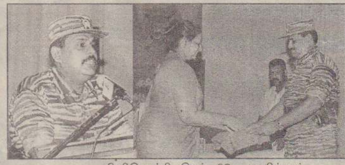
சூசை நேற்று முன்தினம் வெளியிட்டு வைத்தார். பூதசூயிர்ப்பிலுள்ள மாவீரர் மண்டபத்தில் நேற்று முன்தினம் புதன் கிழமை மாலை இந்த நிகழ்வு நடைபெற்றது. பூதசூயிர்ப்பு கேட அரங்கில் பொறுப்பாளர் இளம் பருதி தலைமை

கிளிநொச்சி, செப். 28 வான் புலிகளின் 'சிறகு விரித்த புலிகள்' பாடல் இறுவட்டை தமிழிழை கடற் புலிகளின் சிறப்புத் தளபதி கேணல்