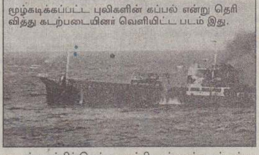
மூழ்கடிக்கப்பட்ட புலிகளின் கப்பல் என்று தெரிவித்து கடற்படையினர் வெளியிட்ட படம் இது.