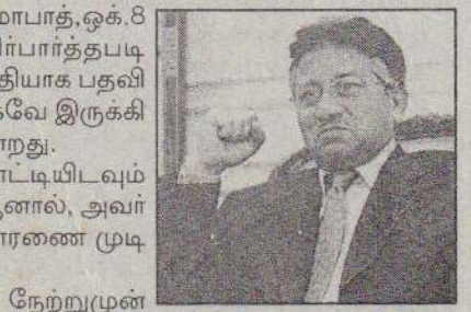
இல்லாமாபாத், ஓக்.8 நேற்றுமுன்தினம் நடைபெற்ற பாகிஸ்தான் ஜனாதிபதித் தேர்தலில் எதிர்பார்த்தபடி பர்வேஸ் முஷாரப் அதிக வாக்குகள் பெற்று வெற்றிபெற்றார். ஆனால், ஜனாதிபதியாக பதவியேற்க உச்ச நீதிமன்றம் சாதகமான தீர்ப்பு வழங்குமா? என்பது கேள்விக்குறியாகவே இருக்கிறது.

பாகிஸ்தான் ஜனாதிபதித் தேர்தலை நடத்தவும் அதில் முஷாரப் மீண்டும் போட்டியிடவும் உச்ச நீதிமன்றத்தின் 10 நீதிபதிகள் அடங்கிய ஆணையம் அனுமதியளித்தது. ஆனால், அவர் மீண்டும் ஜனாதிபதியாகத் தடை விதிக்கக் கோரும் மனு மீதான வழக்கின் விசாரணை முடிவடையும்வரை தேர்தல் முடிவை வெளியிடத் தடைவிதித்தது.