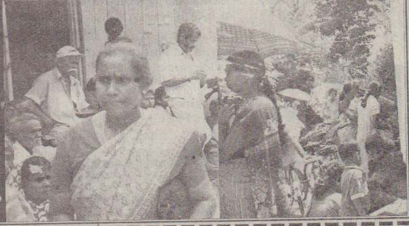
அம்மையாரைக் கண்டு தமது கதை கூறக்காத்திருந்த பாதிக்கப்பட்டவர்களில் மற்றொரு பகுதியினர்..