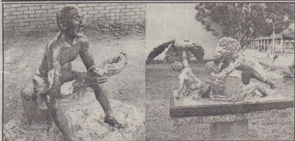
யாழ்ப்பாணம் பல்கலைக்கழகத்தின் மருதனார்மடத்தில் அமைந்துள்ள துண்கலைப் பீட வளாகத்தில் சித்திரமும் வடிவமைப்பும் மாணவர்களினால் நடத்தப்படும் ஒலிபடம், சிற்பம் மற்றும் புகைப்படக் கண்காட்சியில்-

இயற்கையையும் பழமைமையையும் வெளிப்படுத்தும் வகையில் பீடா ஏந்தி மது அருந்துபவரின் சிற்பம் மற்றும் வாழ்வியலுக்காக சிங்கம் பலம் குன்றிய மிருகத்தை அழிப்பது போன்ற சிற்பம் என்பன கற்கள் மற்றும் சிமெந்து கொண்டு அமைக்கப்பட்டுள்ளன.