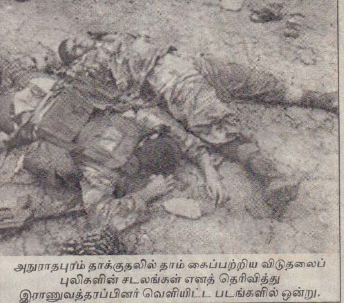
அநுராதபுரம் தாக்குதலில் தாம் கைப்பற்றிய விடுதலைப் புலிகளின் சடலங்கள் எனத் தெரிவித்து இராணுவத்தரப்பினர் வெளியிட்ட படங்களில் ஒன்று.

(முதலாம் பக்கத் தொடர்ச்சி) இருசாராருக்கும் இடையில் நடந்த நீண்ட-பலமணி நேர மோதலில் 9 விமானப்படையினர் உயிரிழந்தனர். 20 பேர் படுகாயமடைந்தனர். "இதேவேளை, சிலமணி நேரங்களில் புறப்பட்டு வந்த புலிகளின் இலகு ரக விமானங்கள் இரண்டும் விமானப்படைத் தளம் மீது இரு குண்டுகளை வீசிவிட்டுச் சென்று விட்டன. இதற்கும் அதற்கும் தொடர்பில்லை. இந்நிலையில் புலிகளைத் தேடி அழிக்கும் நோக்கில் வந்த எமது ஹெலிகொப்டர் ஒன்று இயந்திரக் கோளாறு காரணமாக மிகிந்தலையில் தரையிறங்க முயற்சித்ததில் விபத்துக்குள்ளாகி வீழ்ந்து நொறுங்கியது. இச்சம்பவத்தில் விமானி, உதவி விமானி மற்றும் விமானப்படையினர் என மொத்தம் 4 பேர் பலியாகினர். இந்தச் சம்பவத்துக்கும் புலிகளின் தாக்குதலுக்கும் தொடர்பில்லை. தாக்குதல் ஓய்ந்தபிறகு விமானப்படைத் தளப் பகுதியில் படையினர் மேற்கொண்ட தேடுதலின்போது 20 புலிகளின் சடலங்கள் மீட்கப்பட்டன. இப்போது அந்த தரப்பில் மேலும் தெரிவிக்கப்பட்டது. (அ-சி)