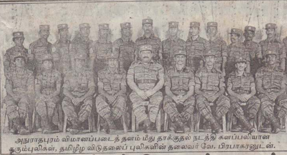
அநுராதபுரம் விமானப்படைத் தளம் மீது தாக்குதல் நடத்தி களப்பலியான தூரும்புலிகள், தமிழீழ விடுதலைப் புலிகளின் தலைவர் வே. பிரபாகரனுடன்.