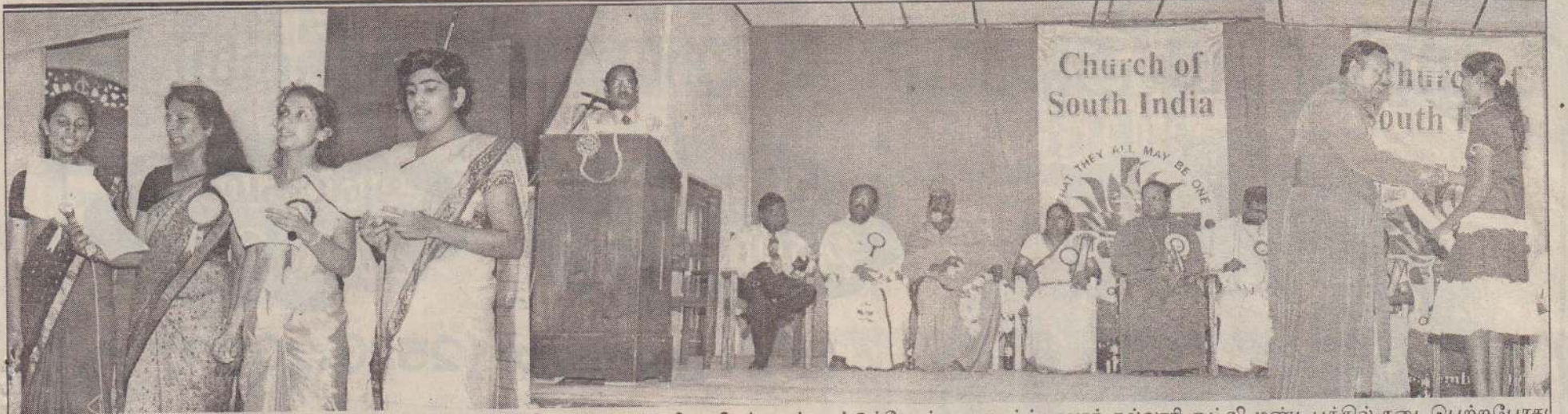
தென்னிந்திய திருச்சபையின் 60ஆவது ஆண்டு நிறைவையொட்டிய வைரவிழா நிகழ்வுகள் வட்டுக்கோட்டை யாழ்ப்பாணக் கல்லூரி ஓட்லி மண்டபத்தில் நடைபெற்றபோது எடுக்கப்பட்ட படங்கள் இவை.