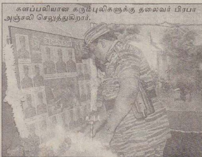
களப்பலியான கரும்புலிகளுக்கு தலைவர் பிரபா அஞ்சலி செலுத்துகிறார்.

இந்த நிகழ்வுகளில் பெரும் எண்ணிக்கையான பொதுமக்களும் போராளிகளும் கலந்துகொண்டனர். (அ-1)