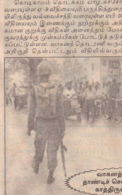
வாகனத் தொடரணி தாண்டிச் செல்லும் வரை காத்திருக்கும் மக்கள்

செல்வோர் வாகனங்களில் செல்லும் வேளைகளிலேயே (காலை 9 மணி தொடக்கம் பகல் 12.30 மணிவரை) வாகனத் தொடரணி வீதிகளில் புறப்படும். அவ்வேளையில் பாதை கள் தடைசெய்யப்படுகின்றன. நோயாளர்களைப் பார்வையிடச் செல்வோர், உணவு கொண்டு செல்வோர் நோயாளர்களைப் பார்வையிடும் நேரம் முடிவடைந்த பின்னர் யாழ்ப்பாணம் சென்றடைவதால் நோயாளரைப் பார்க்க உட்கொண்ட அனுமதிக்கப்படுவதில்லை. இதனால் காலை சமைத்த உணவுடன் வைத்திய சாலை வளாகத்தில் மணிக்கணக்கில் காத்திருக்க வேண்டிய நிலை ஏற்படுகின்றது. வீட்டிலிருந்து மதிய உணவு வரும் என எதிர்பார்த்து விடுதிகளில் தங்கியிருக்கும் நோயாளர்கள் அனைவரும் மூன்று, உணவு அருந்த வேண்டிய நிலை நோயாளர்களைப் பார்வையிட அனுமதித்த பின்னர் உட்கொண்ட