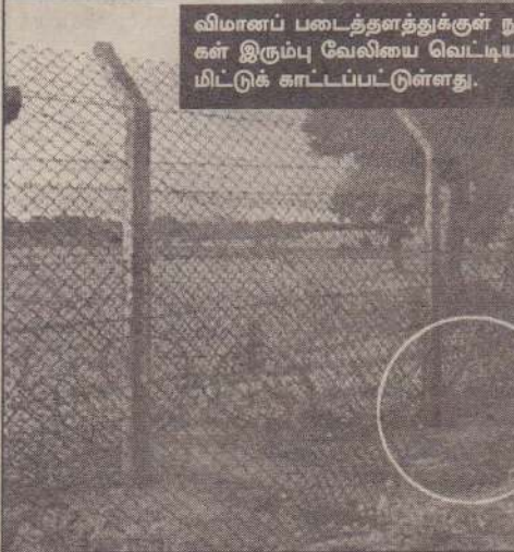
விமானப் படைத்தளத்துக்குள் நுழைவதற்காக கரும்புலிகள் இரும்பு வேலியை வெட்டிய பகுதி படத்தில் வட்டமிட்டுக் காட்டப்பட்டுள்ளது.

வதே அவர்களின் பிரதான நோக்கம். பெல் 212 ரக உலங்குவானூர்தி அநுராதபுரம் நோக்கிச் சென்ற போது விடுதலைப் புலிகளின் விமானங்கள் அநுராதபுரம் வான் பிரதேசத்தில் பிரவேசித்துவிட்டன. அப்போது வவுனியா மற்றும் அநுராதபுரம் படைத்தளங்களின் படைப்படைக்கும் விடுதலைப் புலிகளின் விமானங்களைச் சுட்டு வீழ்த்துமாறு உத்தரவுகள் வழங்கப்பட்டன. ஆனால் அதிகாலை 4.30 மணியளவில் அநுராதபுரத்தில் இருந்து 15 கி.மீ. தொலைவில் உள்ள தொடர்மலர்வப் பகுதியில் பெல் 212 ரக உலங்கு வானூர்தி வீழ்ந்து நொறுங்கியது. பெல் 212 ரக உலங்குவானூர்தி தரையில் இருந்து மேற்கொள்ளப்பட்ட தாக்குதலில் தளச்சிக்கியுள்ளதாக பின்னர் அறிவிக்கப்பட்டுள்ளது. படையினர் அதனை விடுதலைப் புலிகளின் விமானம் எனத் தவறாக எண்ணியுள்ளனர். உலங்கு வானூர்தி தாக்கப்பட்டதும் வவுனியா வான் படைத்தளத்திற்கு அது தொடர்பாக அறிவிக்கப்பட்டமை பின்னர் தெரியவந்துள்ளது. ஆனால் விடுதலைப் புலிகளின் விமானங்கள் இரண்டும் வவுனியாவிலுடனாக சென்று ராடர் திரையில் இருந்து மறைந்துவிட்டன. தரையில் விமான எதிர்ப்பு துப்பாக்கியை கைப்