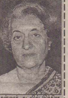
சென்றார். கடலில் இந்திரா