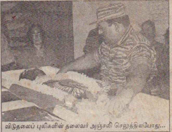
விடுதலைப் புலிகளின் தலைவர் அஞ்சலி செலுத்தியபோது...