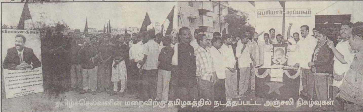
தமிழ்ச்செல்வனின் மறைவிற்கு தமிழகத்தில் நடத்தப்பட்ட அஞ்சலி நிகழ்வுகள்

சமரசப் பேச்சுக்களுக்குச் சிங்கள அரசு தயாராக இல்லை என்பதை வெளிப்படுத்தி விட்டது. மாவீரர்கள் புதைக்கப்படுவதில்லை, விதைக்கப்படுகிறார்கள் என்பதற்கு இணங்க மறைந்த தமிழ்ச்செல்வன் சிந்திய இரத்தத்திலிருந்து ஏராளமான இளைஞர்கள் தோன்றி விடுதலைப் போரைத் தொடர்ந்து நடத்துவார்கள் என்பதில் ஐயமில்லை. மறைந்த தமிழ்ச்செல்வன் அவர்களுக்கு இரங்கல் தெரிவிக்கும் வகையில் தமிழகமெங்கும் கூட்டங்களை நடத்தும் படி அனைத்து தமிழ்த் தேசிய அமைப்புகளை வேண்டிக்கொள்கிறேன் - என்றுள்ளது. (202)