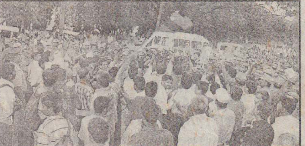
அரசு தடையையும் மீறி பேரணியில் கலந்து கொள்ளத் திரண்டவர்களில் ஒரு பகுதியினர்

கடந்த மே மாதம் குறித்த எம்.பியினால் கொண்டுவரப்பட்ட விவாதத்தின் தொடர்ச்சியாகவே இன்றைய தினமும் இவ்விவாதம் இடம்பெறும் என்பது குறிப்பிடத்தக்கது. (சி)