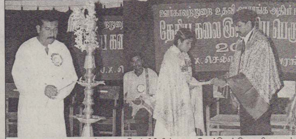
ஊர்காவற்றுறை உதவி அரச அதிபர் பிரிவின்கலை இலக்கியப் பெருவிழா அண்மையில் நடைபெற்றது. நிகழ்வில் ஊர்காவற்றுறை உதவி அரச அதிபர் க.ஸ்ரீமோகனன் மங்கள விளக்கேற்றி ஆரம்பித்து வைப்பதையும் - ஊர்காவற்றுறை மாவட்ட நீதிபதி ஏ.சி.அலெக்ஸ்ராஜா தேசிய கலை இலக்கிய சிறுகதைப் போட்டியில் வெற்றிபெற்ற மாணவிக்குப் பரிசில் வழங்குவதையும் படங்களில் காணலாம்.

கம்பம் ஒன்று மட்டுமே அமைக்கப்பட்டுள்ளது. அத்துடன் தெருவிளக்குகள் எதுவும் இப்பகுதியில் இல்லை. வீதிகள் எவையும் புனரமைப்புச் செய்யப்படவில்லை. இப்பகுதியில் முன்னர் பொதுமலசலகூடம் அமைக்கப்பட்டிருந்தது. அதுபின்னர் இல்லாமல் செய்யப்பட்டு சில குடியிருப்பாளர்களுக்கு மட்டும் அமைத்துக் கொடுக்கப்பட்டது. அவையும் தற்போது அழிவடைந்துவிட்டன. இதனால் பொது இடங்களில் மலசலம் கழிக்கப்படுவதால் தொற்று நேயங்கள் ஏற்படக்கூடிய நிலைமை தோன்றியுள்ளது. எனவே இவ்விடயத்தில் உரிய நடவடிக்கை மேற்கொண்டு மக்களின் குறைபாடுகள் நீங்க நடவடிக்கை எடுக்கவேண்டும் - என்றுள்ளது. (203)