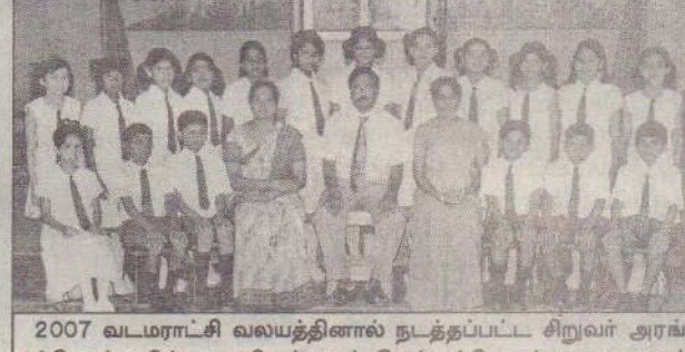
2007 வடமராட்சி வலயத்தினால் நடத்தப்பட்ட சிறுவர் அரங்கப்போட்டியில் முதலிடத்தைப் பெற்றுக்கொண்ட மாணவர்களுடன் அதிபரும் நெறிப்படுத்திய ஆசிரியர்களும்.