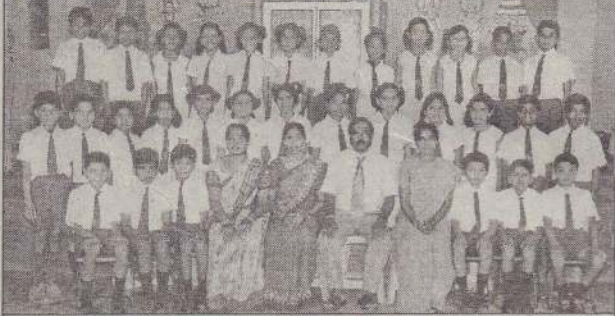
2007 தரம் 5 புலமைப்பரிசில் பரீட்சையில் சித்தியெய்திய மாணவர்களுடன் அதிபர், ஆசிரியர்கள்.