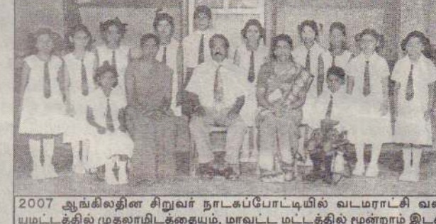
2007 ஆங்கிலத்தின் சிறுவர் நாடகப்போட்டியில் வடமராட்சி வலயமட்டத்தில் முதலாமிடத்தையும், மாவட்ட மட்டத்தில் மூன்றாம் இடத்தையும் பெற்றுக்கொண்ட மாணவர்களுடன் அதிபரும் நெறிப்படுத்திய ஆசிரியர்களும்.