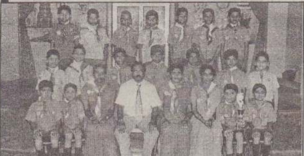
2007 சிரேஷ்ட குருளைச் சாரண மாணவர்க்கு- மாவட்டச் சம்பியன், பாடசாலை அதிபர், சாரண ஆசிரியர்களுடன் சாரணர்க்கு.