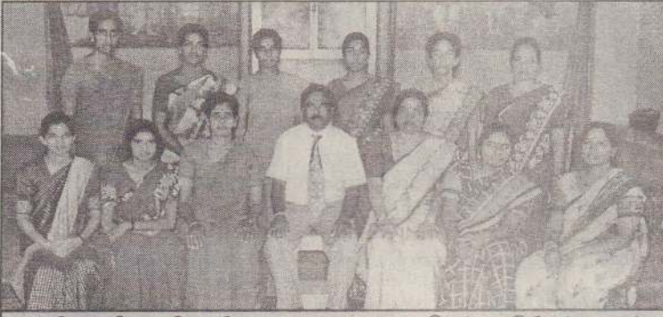
யா/நெல்லியடி மெ.மி.த.க.பாடசாலை அதிபர், ஆசிரியர் குழாம்.