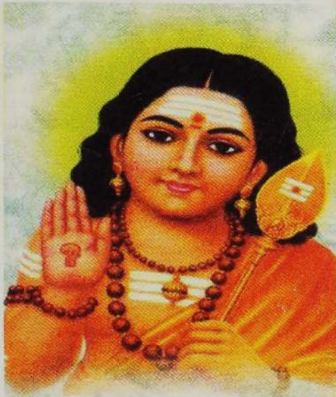
வெற்றியைத் தருவனே சக்திவேலன்