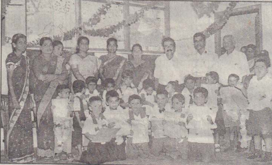
அல்லாரை ஐங்கரன் முன்பள்ளியில் அண்மையில் இடம்பெற்ற சிறுவர் தின விழாவில் முன்பள்ளி சிறார்களும், ஐந்தாம் தர புலமைப்பரிசில் பரீட்சையில் சித்திபெற்ற முன்பள்ளியின் பழைய மாணவர்களும் கௌரவிக்கப்பட்டனர். கௌரவிப்பு நிகழ்வில் கலந்துகொண்ட விருந்தினர்களுடன் கௌரவிக்கப்பட்ட மாணவர்களை படத்தில் காணலாம்.

கப்படுகிறது. பிரதி புதன்கிழமைகளில் பிரதேச செயலகங்களுக்கு வந்து கிராம அலுவலர்களைச் சந்திக்கவேண்டிய நிலை பொது மக்களுக்கு ஏற்படுகிறது. கிராம அலுவலர்கள் புதன்கிழமைகளில் பிரதேச செயலகங்களுக்கு சமூகமளிக்கவேண்டுமென அறிவுறுத்தப்பட்டுள்ளபோதிலும் கிராம அலுவலர்கள் தாம் நினைத்த நேரத்தில் பிரதேச செயலகத்திற்கு வருகை தருவதால் பொதுமக்கள் நீண்டநேரம் காலைக் காத்திருக்க வேண்டியுள்ளதாக முறையிடப்படுகிறது. (207)