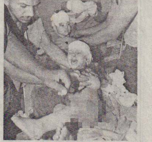
பலஸ்தீனியரைப் பலவந்தமாகக் குடிபெயர்த்த இஸ்ரேலியர்கள் மத்திய கிழக்கின் சுதந்திரம், ஜனநாயக வாதம் மற்றும் மனித

இன்றைய மேற்குலக நாடுகளான பலவான்களின் ஆசிரீவாதத்துடன் மேற்கொள்ளப்படும் யுத்தம், இஸ்ரேலுக்குப் பெரும் அனுகூலத்தை வழங்கி வருகிறது.