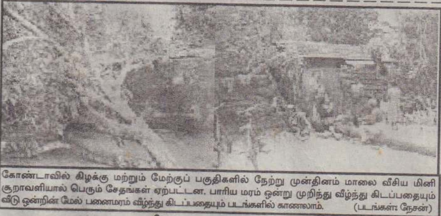
கோண்டாவில் கிழக்கு மற்றும் மேற்குப் பகுதிகளில் நேற்று முன்தினம் மாலை வீசிய மினி குறாவனியால் பெரும் சேதங்கள் ஏற்பட்டன. பாரிய மரம் ஒன்று முறிந்து வீழ்ந்து கிடப்பதையும் வீடு ஒன்றின் மேல் பணமரம் வீழ்ந்து கிடப்பதையும் படங்களில் காணலாம்.