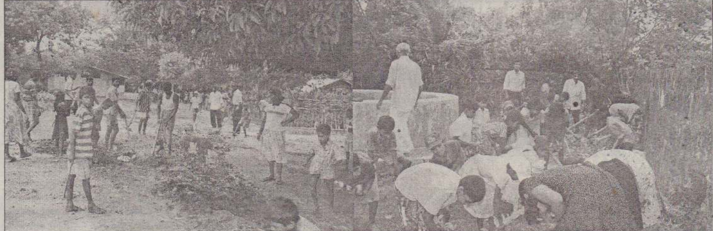
பெங்கு நோய் வருமுன் காத்தல் விழிப்புணர்வுச் சிரமதானப் பணி அண்மையில் தொல்புரம் மேற்கு கிராம அலுவலகம் பிரிவில் நடைபெற்றது.

மாற்று வழிகளில் அதற்கான ஏற்பாடுகளைச் செய்ய பூர்வங்கள் எயர் லைன்ஸ் தயாராக இருந்தபோதிலும் ஜனாதிபதியின் பயணத்திற்கான ஏற்பாடுகளைச் செய்வதற்கு ஆர்வம் காட்டவில்லை என்றும் கூறப்படுகின்றது. (சி)