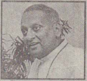
யாழ். குடாநாட்டு நிலைமை குறித்து நேற்று விடுத்த அறிக்கையிலேயே அவர் இதனைக் குறிப்பிட்டுள்ளார்.

- இவ்வாறு சுட்டிக்காட்டியிருக்கிறார் இலங்கை அங்கிலிக்கன் திருச்சபையின் பேராயர், உயர் அருள் பணி டிஸ்ப் டி சிக்கோ.