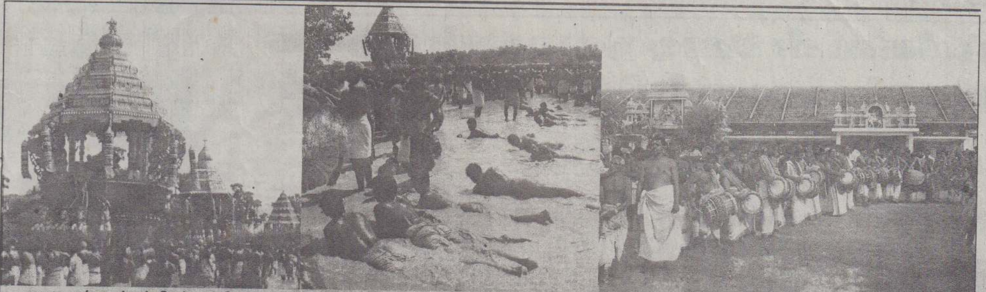
காரைநகர் ஈழத்துச் சிதம்பரத்தில் மார்கழித் திருவாதிரை அன்று பஞ்சரத பவனி இடம்பெற்றது. ஐயனாருக்குப் புதிதாக உருவாக்கப்பட்டுள்ள சித்திரத்தேர் முன்னுக்கும் அதனையடுத்து சிவனின் சித்திரத் தேருமாக ஐந்து தேர்கள் ஆலயத்தின் முன் வீதியில் நிறுத்தப்பட்டிருப்பதை முதலாவது படத்தில் காணலாம். மழைவெள்ளத்தில் அடியார்கள் அங்கப் பிரதிஷ்டை செய்வதை இரண்டாவது படத்திலும் தவில், நாதஸ்வரக் கலைஞர்கள் நாதகான மழை பொழிவதை மூன்றாவது படத்திலும் காணலாம்.