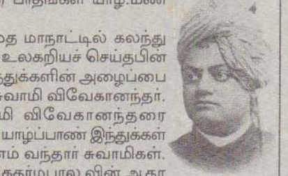
இன்றும் நினைவில் கொள்ள..... அன்றைய ரூபகம் ... இங்கே!

ஜனவரி 25 ஆம் திகதி வேதாந்தம் என்ற தலைப்பில் யாழ்ப்பாணத்தில் சொற்பொழிவாற்றினார் சுவாமி. விவேகானந்தரின் சொற்பொழிவிலிருந்து சில வரிகள்:- "உலகிலுள்ள ஒவ்வொருவரும் ஒரே சமயத்தை ஏற்றுக்கொண்டு ஒரேவழியைப் பின்பற்றினால் உலகம் முழுவதிற்கும் துன்பமே வந்து சேரும். வாழ்க்கையின் அடிப்படையே வேற்றுமைதான். வேற்றுமைகளுக்காக நாம் சண்டையிடத் தேவையில்லை. வெளிநாட்டிலிருந்து சிலர் வந்து இது ஒன்றுதான் வழி இதைவே எல்லோரும் பின்பற்ற வேண்டும் எனக் கூறுகின்றனர். இவர்களைப் பார்க்கச் சிரிப்புத்தான் வருகிறது. உங்களுடைய வழி உங்களுக்கு நன்றாக இருக்கலாம். ஆனால், எனக்கு நன்றாக இருக்காது"