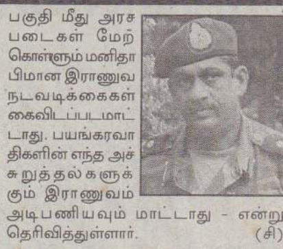
பகுதி மீது அரசு படைகள் மேற்கொள்ளும் மனிதாபிமான இராணுவ நடவடிக்கைகள் கைவிடப்படமாட்டாது. பயங்கரவாதிகளின் எந்த அச்சுறுத்தல்களுக்கும் இராணுவம் அடிபணியவும் மாட்டாது - என்று தெரிவித்துள்ளார். (சி)